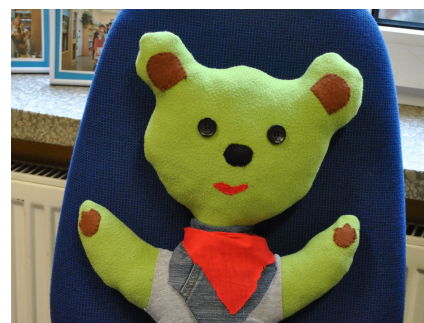
Biblioteczny miś K.S.