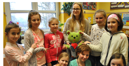
Lubimy naszego misia K.S.