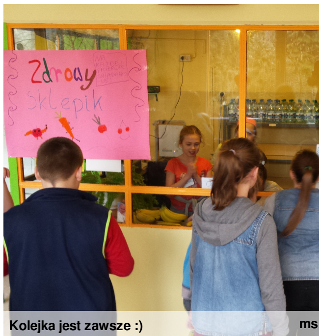
Kolejka jest zawsze :)