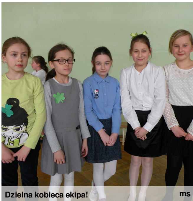
Dzielna kobieca ekipa!