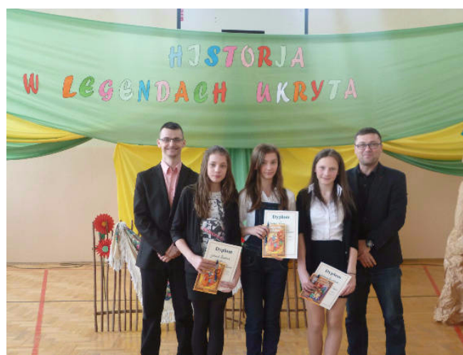
Pamiętkowe zdjęcie z konkursu w Małej