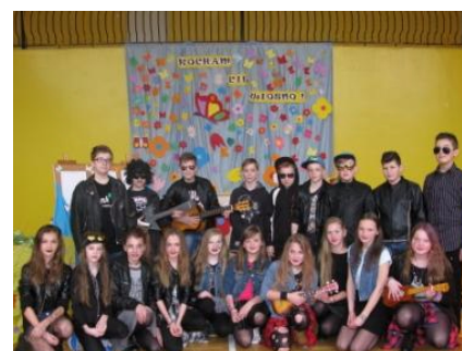
Najlepiej przebrana klasa - V LN

21 marca przypada Pierwszy Dzień Kalendarzowej Wiosny. W naszej szkole tradycją stała się wiosenna i radosna zabawa, w niepamięć odszedł tzw. Dzień Wagarowicza.