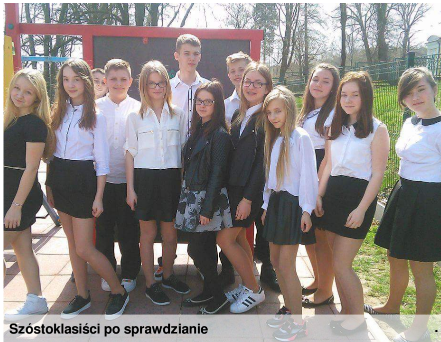
Szóstoklasiści po sprawdzianie