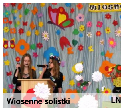
Wiosenne solistki LN

21 marca przypada Pierwszy Dzień Kalendarzowej Wiosny. W naszej szkole tradycją stała się wiosenna i radosna zabawa, w niepamięć odszedł tzw. Dzień Wagarowicza.