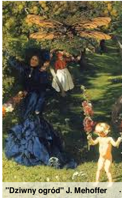
"Dziwny ogród" J. Mehoffer

Życiowa rozsypanka "Dziwny ogród" to dzieło budzące wiele kontrowersji. Za każdym razem, kiedy na nie patrzę