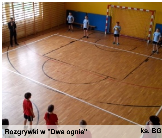
Rozgrywki w "Dwa ognie"