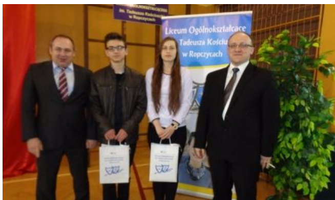
Foto z organizatorami konkursu