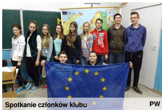
Spotkanie członków klubu