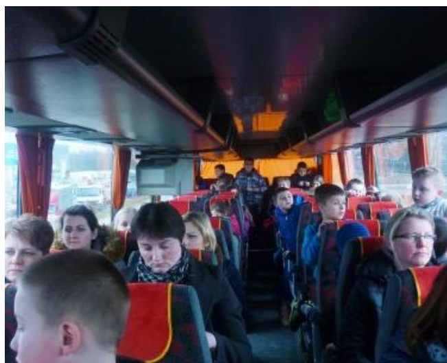
W wycieczkowym autobusie