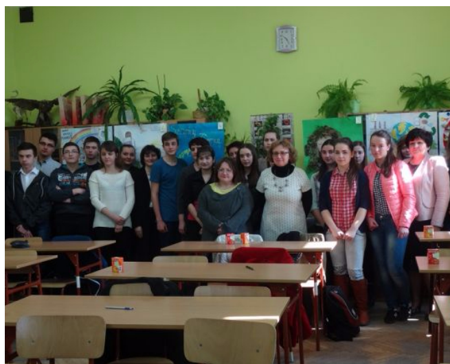
Uczestnicy konkursu przyrodniczego