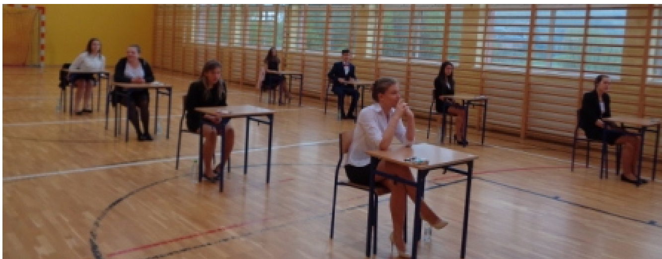
Na sali egzaminacyjnej