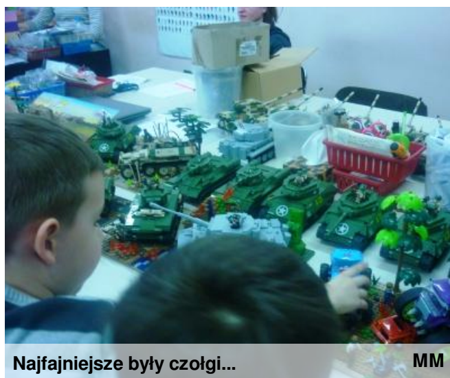
Najfajniejsze były czołgi...