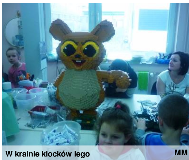
W krainie klocków lego