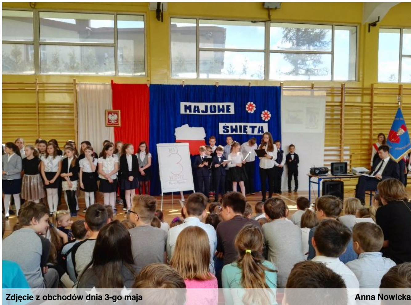
Zdjęcie z obchodów dnia 3-go maja