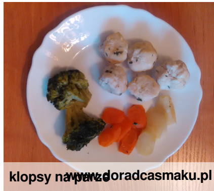
klopsy na parze doradcasmaku.pl

Składniki: ~pierś z kurczaka 1 szt ~kasza manna 2 łyżeczki ~natka pietruszki 1