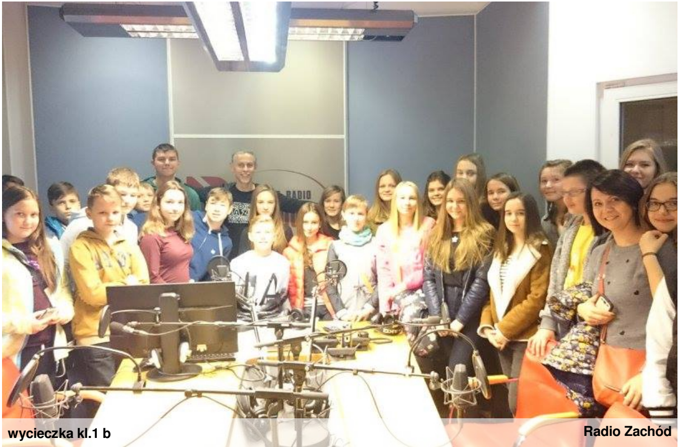
wycieczka kl.1 b