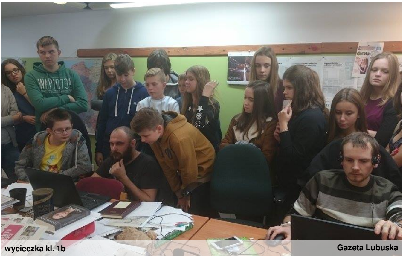
wycieczka kl. 1b