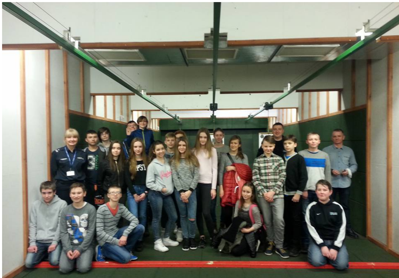
Wycieczka na Policję