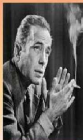
Humphrey Bogart 1899-1957