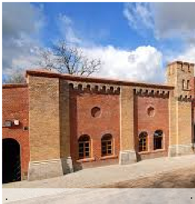
MUZEUM TWIERDZY KOSTRZYN NAD ODRĄ