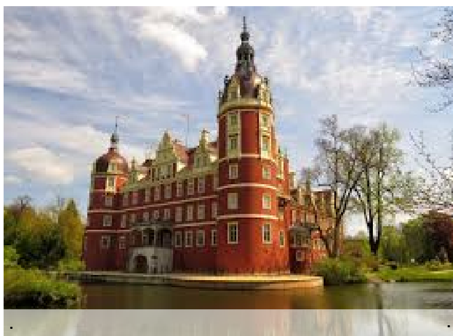
"ŚWIETNY SPACER Z ELEMENTAMI HISTORII..."