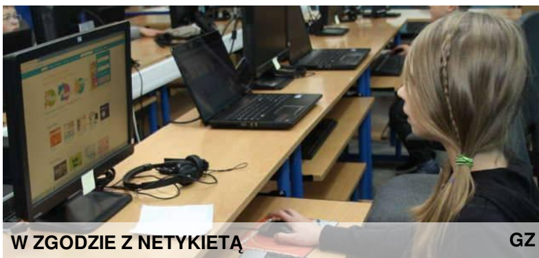
W ZGODZIE Z NETYKIETĄ