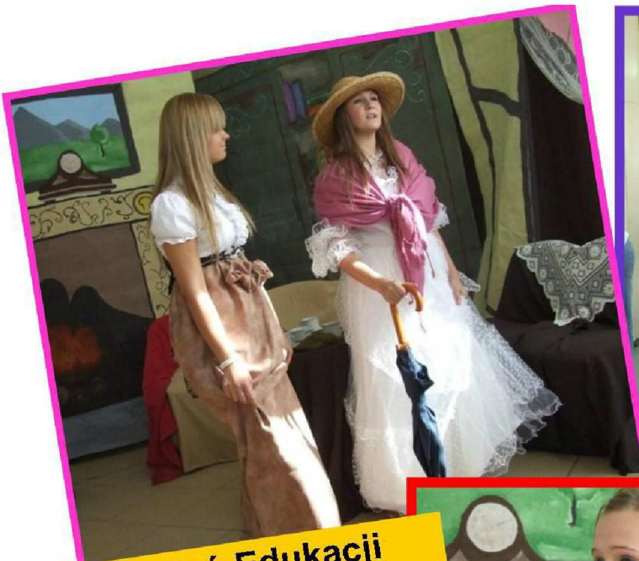
Dzień Edukacji Narodowej