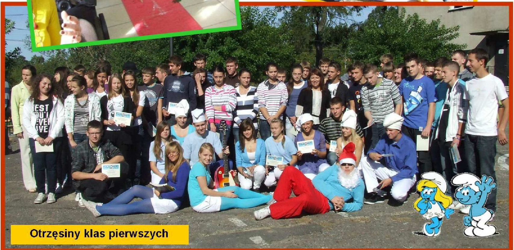
Otrzęsiny klas pierwszych