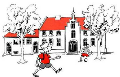
Dzień Edukacji Narodowej