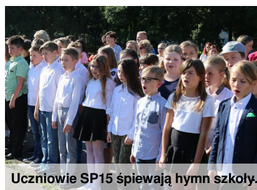
Uczniowie SP15 śpiewają hymn szkoły.

Wypoczęci uczniowie i nauczyciele Szkoły Podstawowej nr 15 spotkali się na uroczystym rozpoczęciu roku szkolnego 2016/17. Pierwszy dzwonek radośnie oznajmił koniec wspaniałych wakacji. Przez najbliższe 10 miesięcy będziemy starać się nauczyć jak najwięcej, tak aby byli dumni z nas nasi kochani rodzice i nauczyciele.