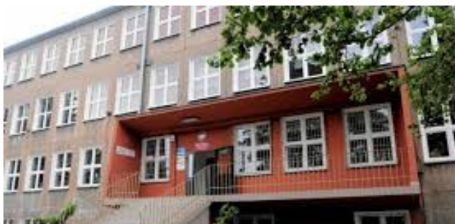
Szkoła Podstawowa nr 15 w Olsztynie