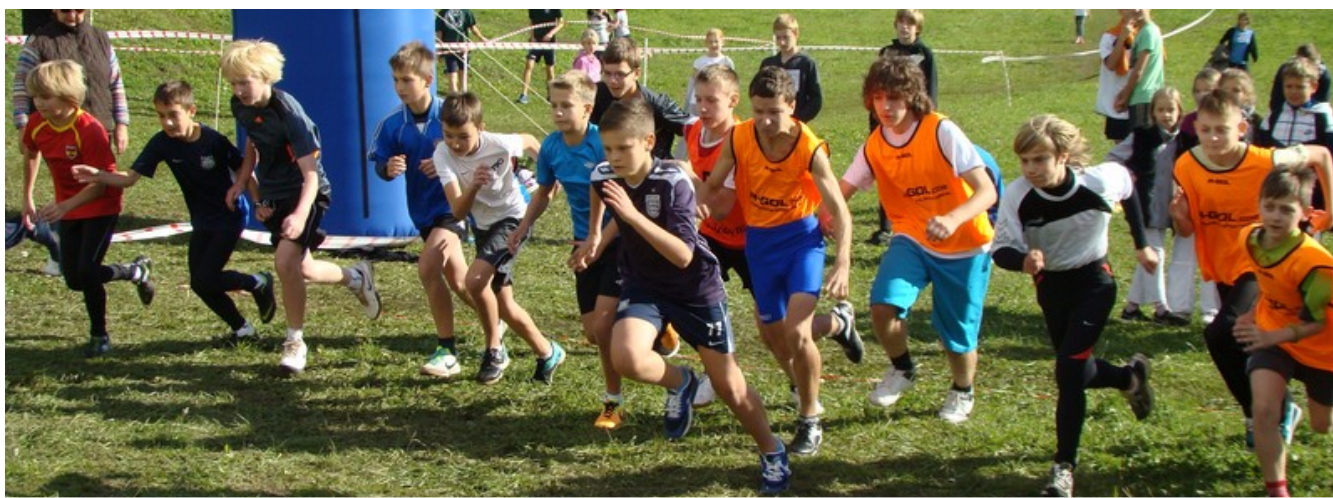
GOTOWI ! START !