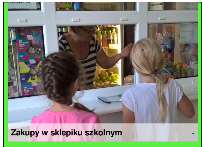
Zakupy w sklepiku szkolnym

Dobrym pomysłem na drugie śniadanie jest musli. Musimy ze sobą wziąć trzy pojemniczki. W jednym jogurt naturalny, w drugim musli, w trzecim owoce.