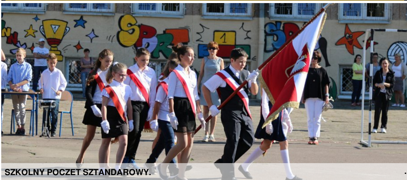
SZKOLNY POCZET SZTANDAROWY.