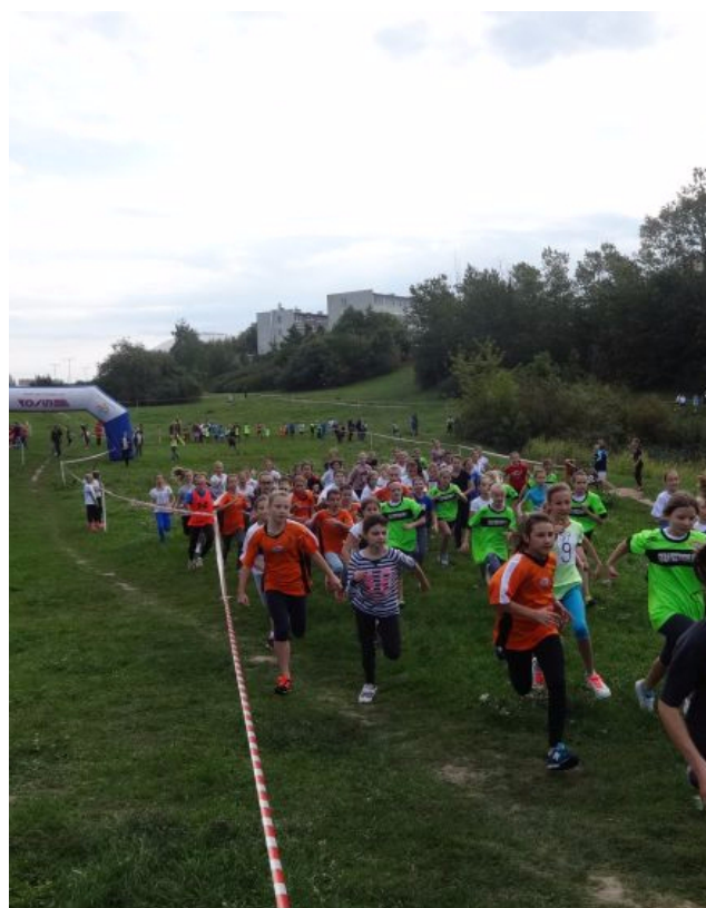
Tu każdy daje z siebie wszystko.

Naszym superbiegaczom życzymy dalszych sukcesów w tym pięknym sporcie. Pozostałym uczestnikom radzimy nie zrażać się i cierpliwie pracować nad doskonaleniem swoich umiejętności. A niebawem przyjdzie taki dzień, w którym osiągniecie najwyższe lokaty.