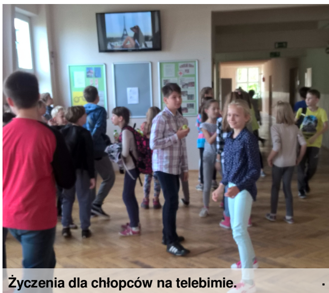
Życzenia dla chłopców na telebimie.