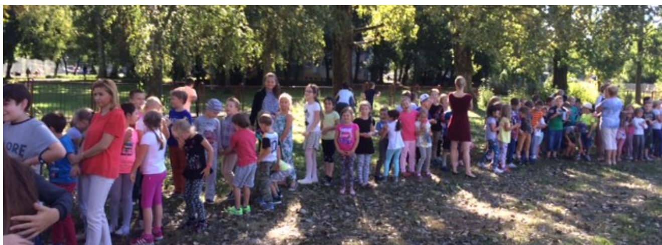
Uczniowie SP15 uczestniczą w próbnej akcji ewakuacyjnej.

Chyba nigdy nie chciałabym przeżyć takiego wydarzenia naprawdę. Takie ćwiczenia są potrzebne, abyśmy wiedzieli jak się zachować w razie niebezpieczeństwa. W szkołach ćwiczy się ewakuację raz w roku, abyśmy zapamiętali jak prawidłowo się zachowywać i nie panikować. W takich sytuacjach najważniejszy jest spokój, opanowanie, a przede wszystkim należy słuchać się dorosłych. Natka