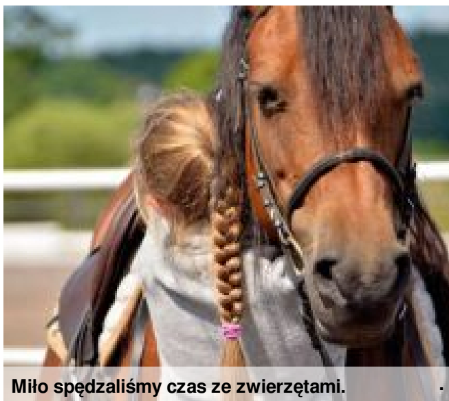
Miło spędzaliśmy czas ze zwierzętami.