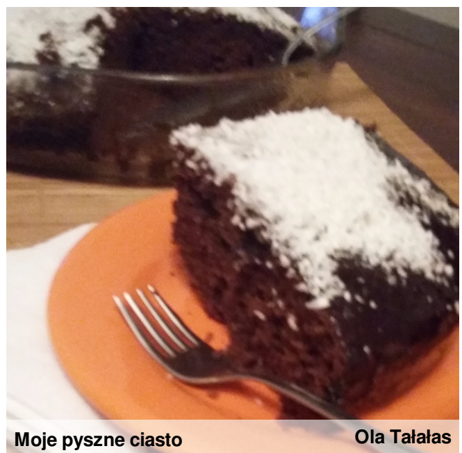
Moje pyszne ciasto