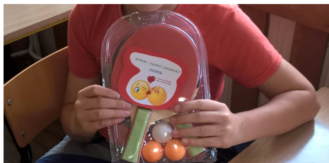
Prezenty dla chłopców z 6a.