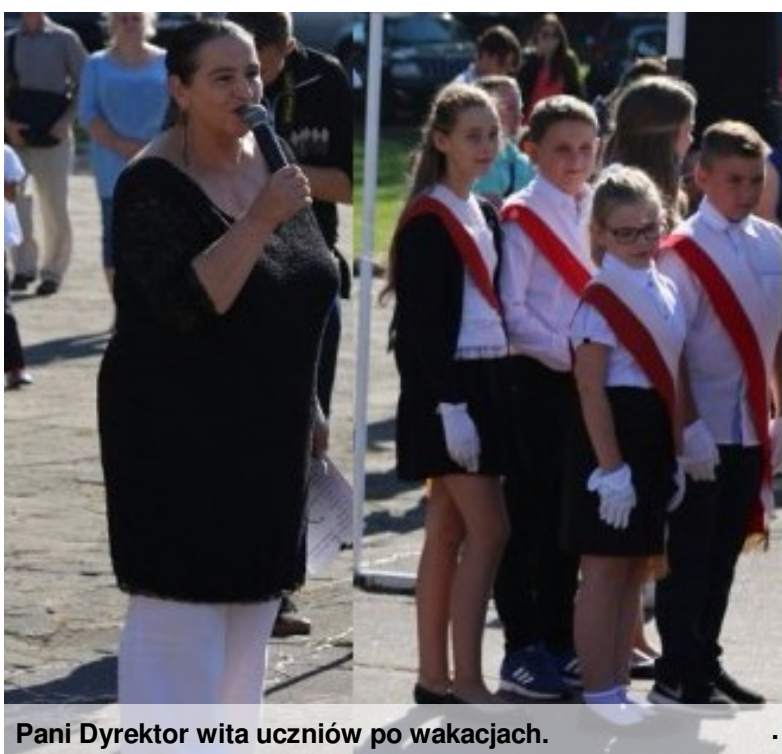
Pani Dyrektor wita uczniów po wakacjach.