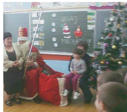
fot. Mikołaj w klasie 0

jeszcze miłe i dowcipne powiedzonko. Obdarowani cieszyli się bardzo, a twarze promieniały radością. Nawet czworo młodszych dzieci, które przybyły na spotkanie z Mikołajem, odebrało bez strachu swoje prezenty. Obecni na niej