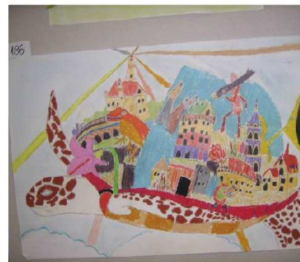
Jedna z nagrodzonych prac...

10 X 2011r. roku rozstrzygnięto konkurs plastyczny pt „ Podróż w Krainę Fantazji ” zorganizowany przez Lubartowski Ośrodek Kultury.