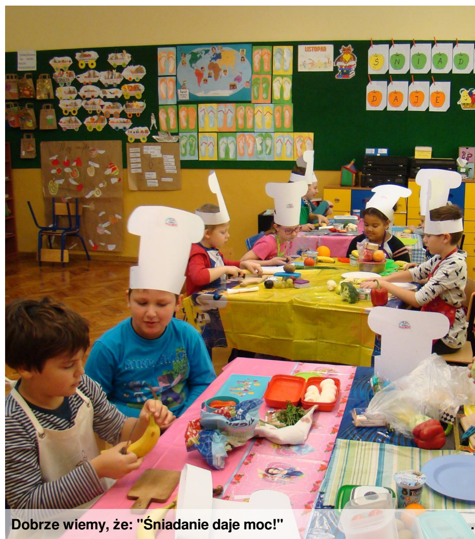
Dobrze wiemy, że: "Śniadanie daje moc!"