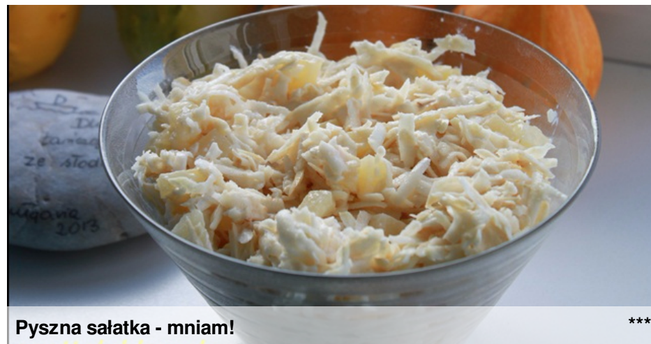
Pyszna sałatka - mniam!

Nie podałam ilości składników, ponieważ można jej zrobić tyle, ile chcecie.