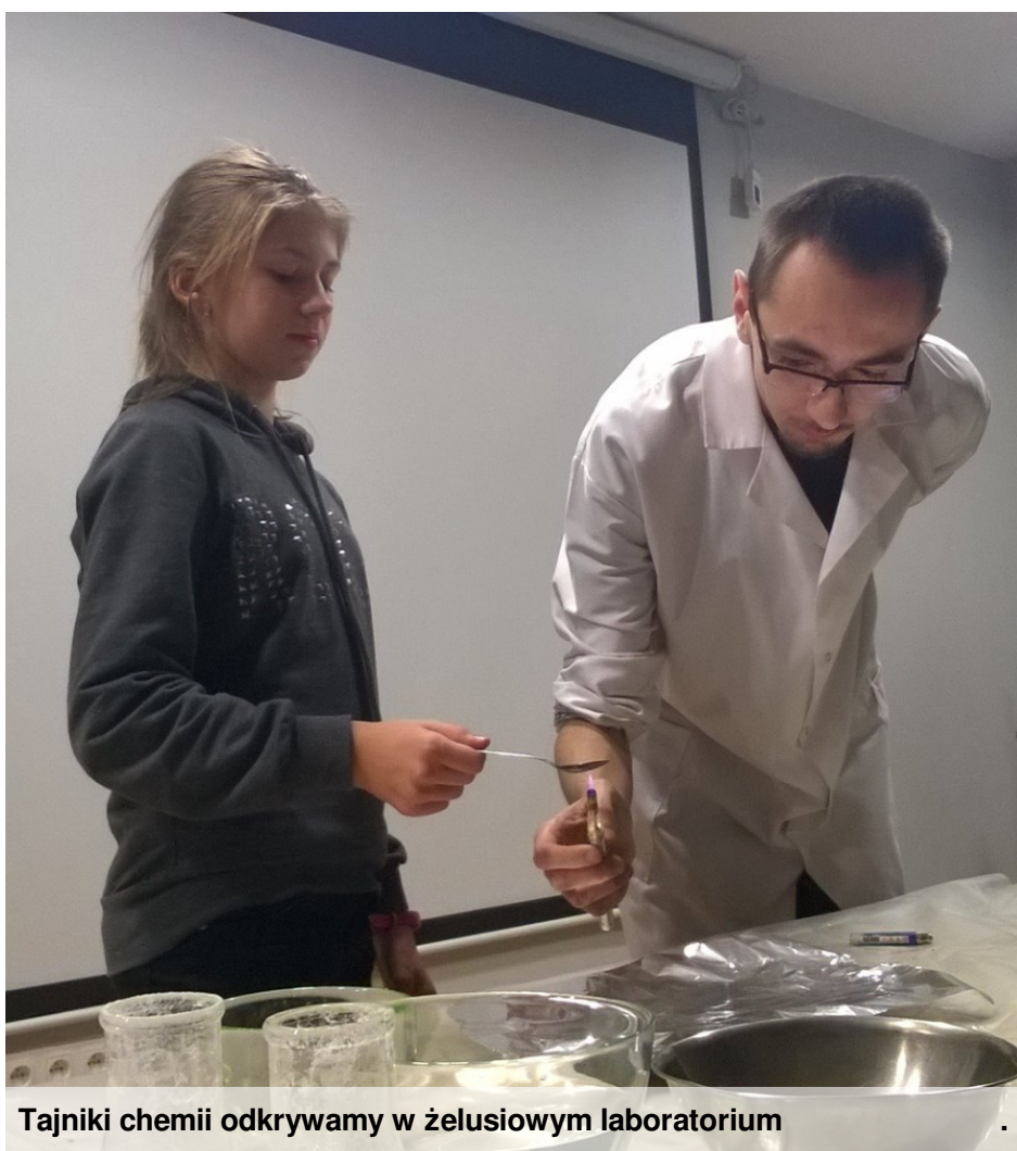
Tajniki chemii odkrywamy w żelusowym laboratorium