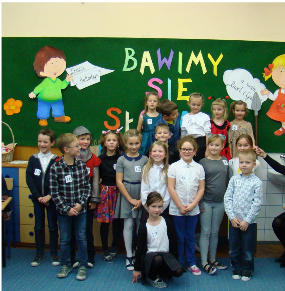
Finaliści konkursu recytatorskiego BAWIMY SIĘ SŁÓWAMI