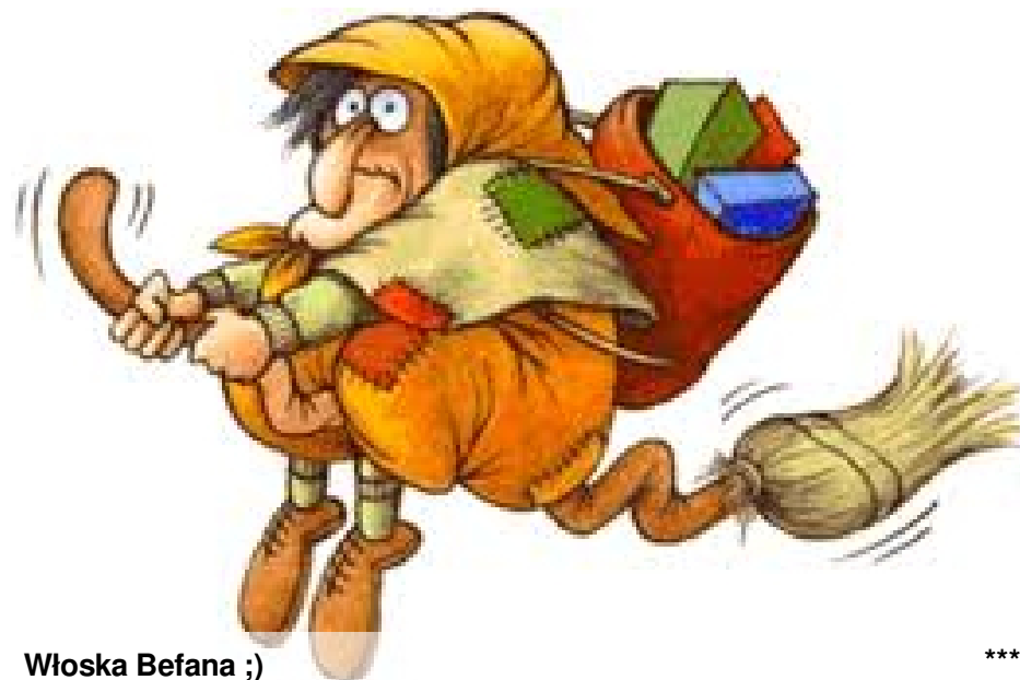
Włoska Befana ;)

We Włoszech prezentów nie przynosi Mikołaj, nie znajdziemy ich też pod choinką. Dostarcza je La Befana - wiedźma z zakrzywionym nosem.