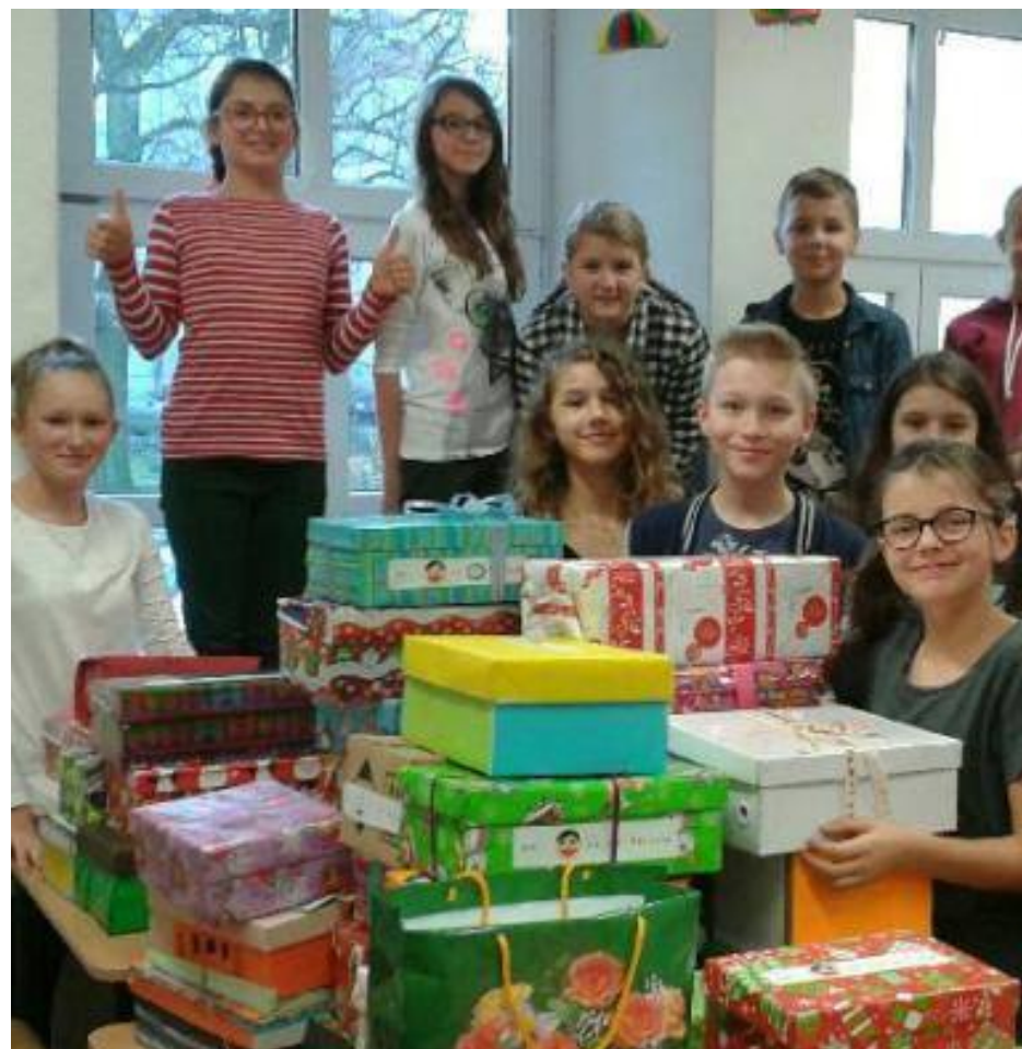
Nie każdy ma tyle szczęścia co my, ale my potrafimy się dzielić. Akcja "Prezent pod choinkę"