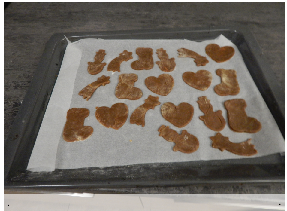
Wylóż blachę papierem do pieczenia i wylóż pierniki .