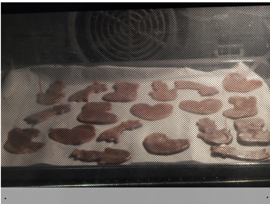
Włóż do nagrzanego piekarnika na ok. 30 min.