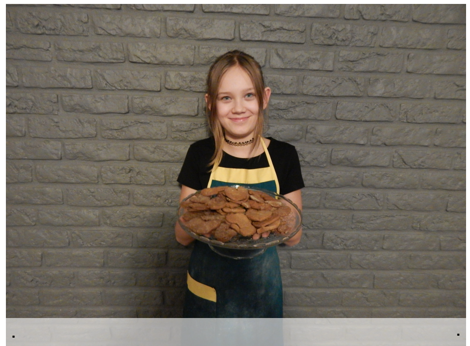
Smacznego !!! :) <3