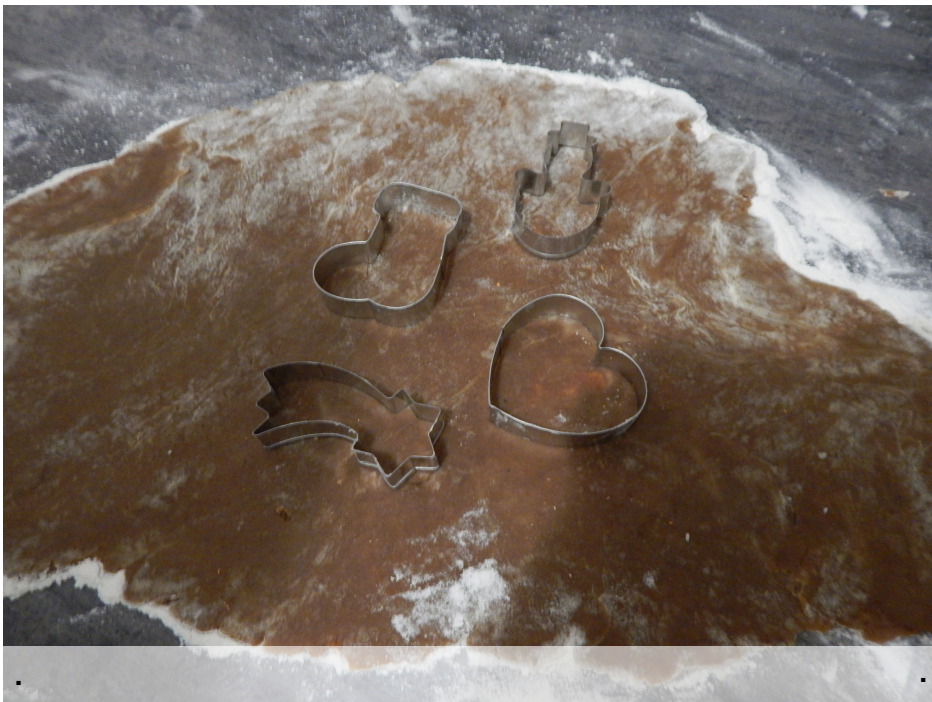
Wykrawaj świąteczne kształty.