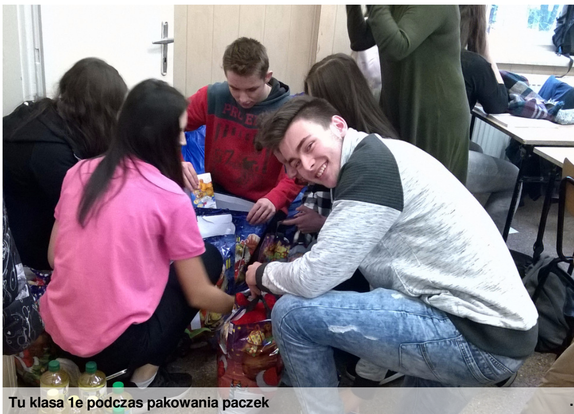
Tu klasa 1e podczas pakowania paczek

Przez cały listopad zbieraliśmy produkty żywnościowe o przedłużonym terminie ważności oraz słodycze, zabawki, przybory szkolne dla polskich dzieci i polskich rodzin z Kresów.