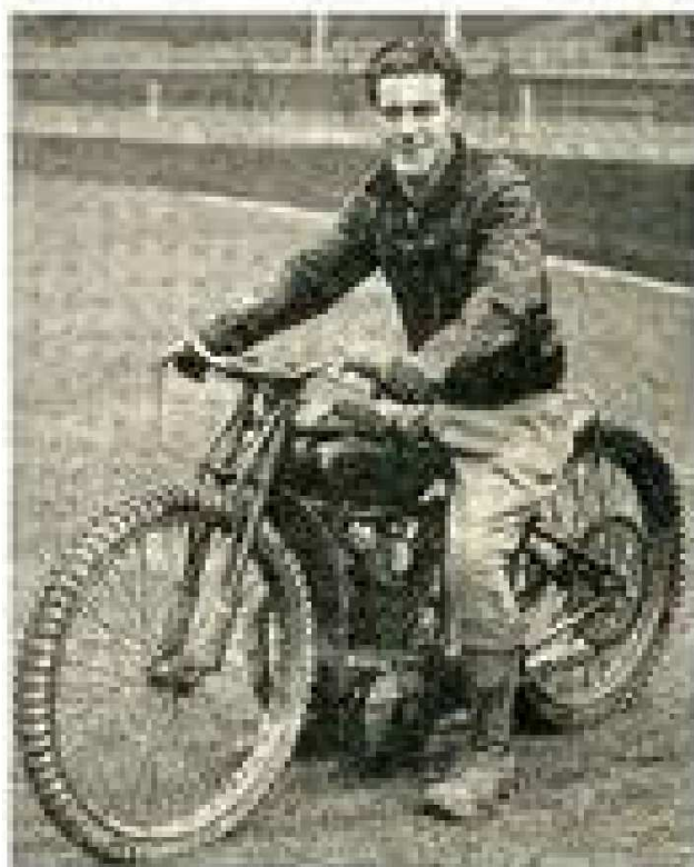
1936 Lionel Van Praag