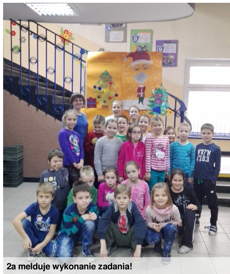
2a melduje wykonanie zadania!