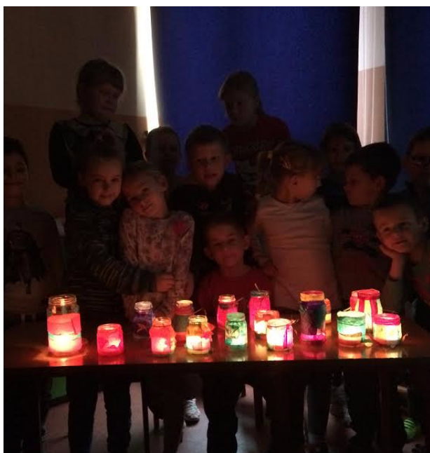
Klasa 2b i ich dzieła