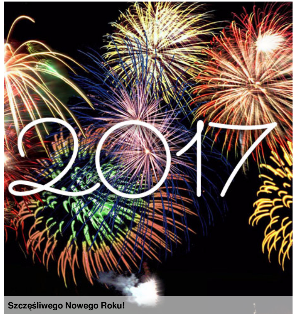
Szczęśliwego Nowego Roku!