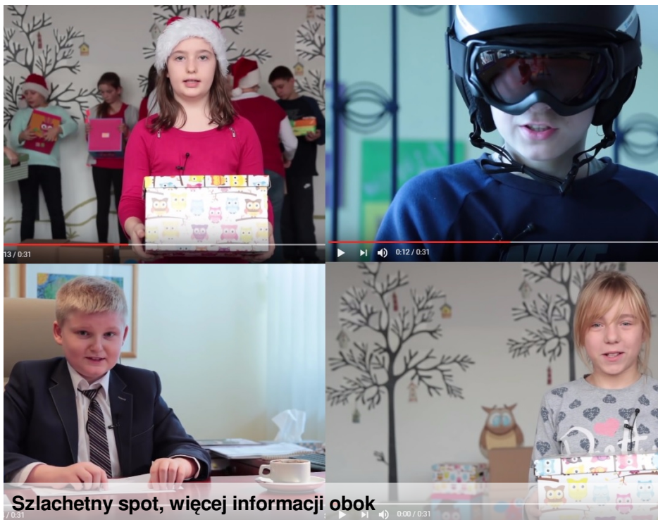
Szlachetny spot, więcej informacji obok