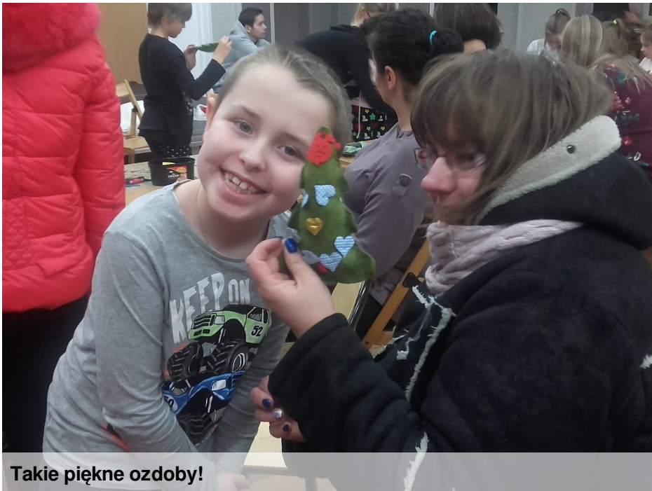
Takie piękne ozdoby!