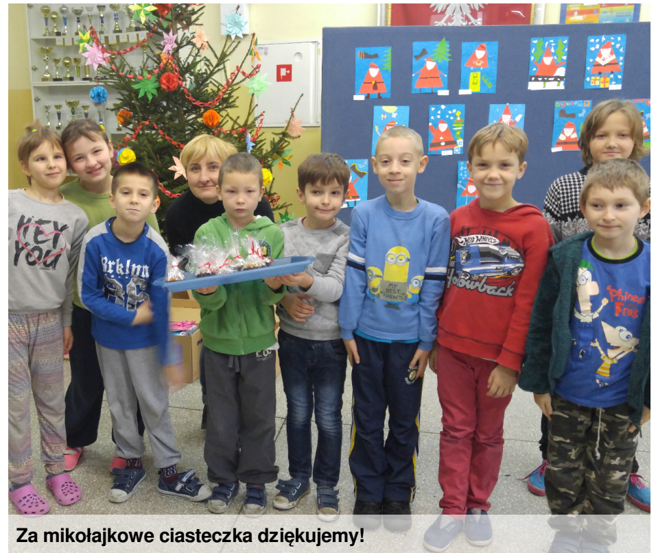
Za mikołajkowe ciasteczka dziękujemy!