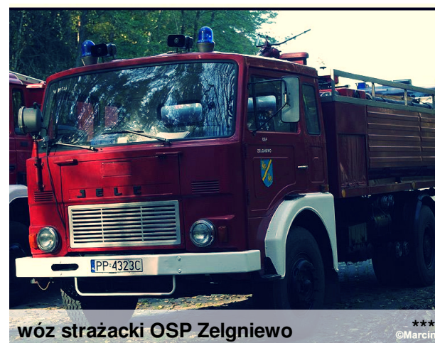
wóz strażacki OSP Zelgniewo