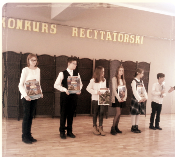
"Wędrówka szlakiem wartości"