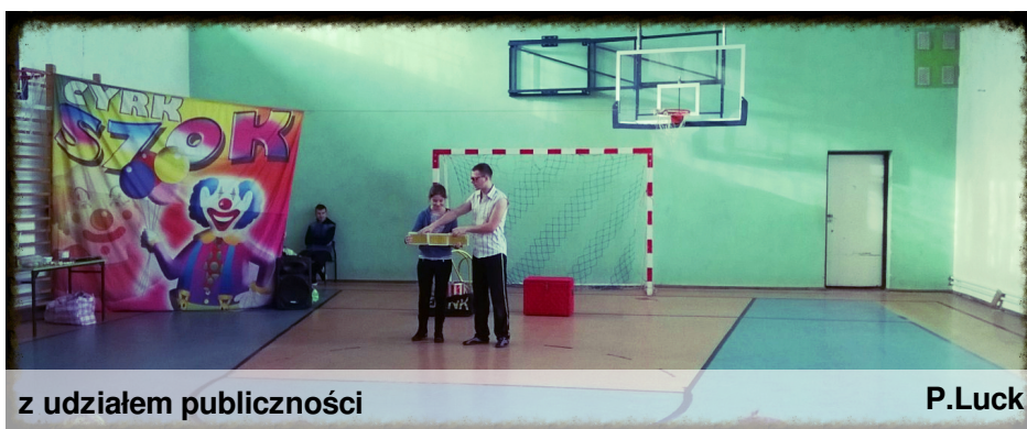
z udziałem publiczności