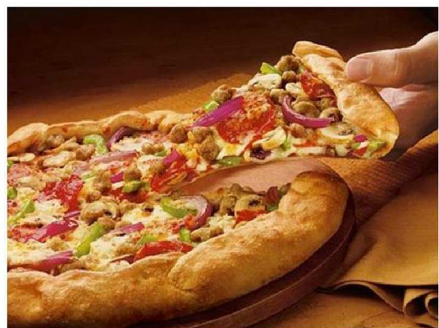
Pizza , najlepszy towar eksportowy Włochów. Je się ją dzisiaj w wielu krajach, ale ten placek z drożdżowego ciasta z dodatkami pochodzi właśnie z Włoch. Polacy często jedzą pizzę na grubym cieście, ale oryginalna pizza włoska jest cienka i zawiera bardzo niewiele dodatków. Było to bowiem dawniej danie biedoty. Niezbędnym składnikiem każdej pizzy jest sos pomidorowy oraz ser mozzarella – to z niego powstają te przepyszne bąble na waszej pizzy.