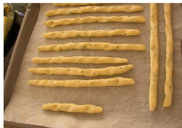
Paluszki chlebowe zwane grissini