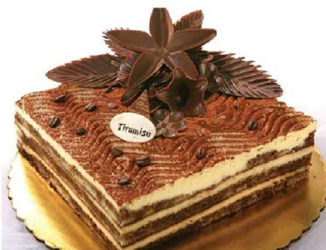
Tiramisu , deser włoski robiony z biszkoptów nasączonych kawą i likierem amaretto oraz serka przypominającego twarożek czyli włoskiego mascarpone.