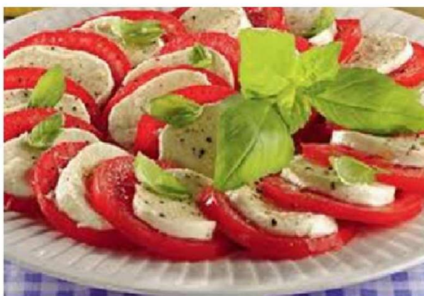
Sałatka caprese w narodowych barwach włoskich. Zrobiona z zielonej bazylii, białego sera zwanego mozzarella oraz czerwonych pomidorów.