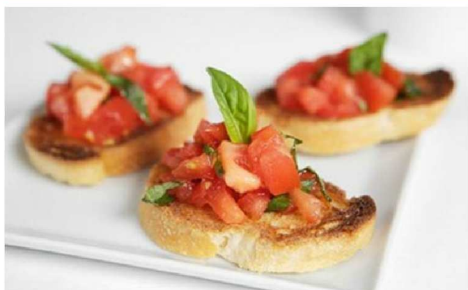
Bruschetta: grzanka czosnkowa, którą włosy jadają najczęściej z pomidorem i bazylią.