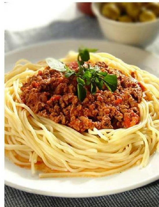
Ukochane przez wielu spaghetti to po prostu makaron w kształcie nitki, ale wielu z nas pod tą nazwą widzi danie z obrazka czyli spaghetti z sosem bolońskim.