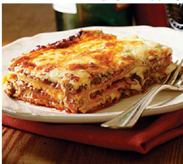
Lasagne – ulubione danie kota Garfilda – to platy makaronu przekładane sosem mięsny i beszamelowym, zapieczone z serem.