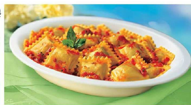
Powyżej ravioli czyli pierzochki o charakterystycznym kształcie. A po lewej risotto - danie włoskie sporządzone z ryżu i warzywnych dodatków.