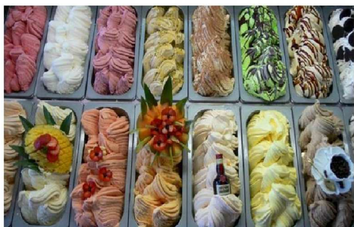
Gelato to oczywiście po prostu lody, ale niewielu wie, że Europejczycy zawdzięczają lody właśnie Włochom. Sposób przygotowywania tego deseru był już znany we Włoszech w XIV wieku i stamtąd rozpowszechnił się na resztę Europy. Gdyby nie włosy nie moglibyście dziś zająć się gałkami w tyłu smakach. I uwaga! Nie dajcie się zwieść. Lody z automatu – wasze świderki i kręciły - to wcale nie lody włoskie!