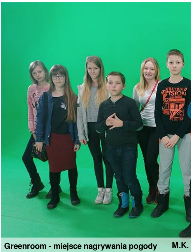
Greenroom - miejsce nagrywania pogody