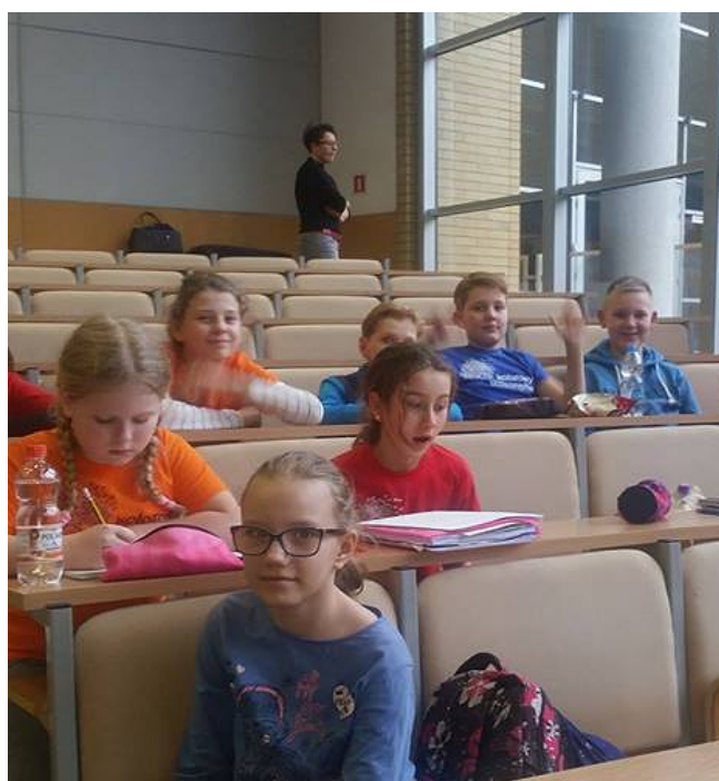
Uczniowie podczas wykładu