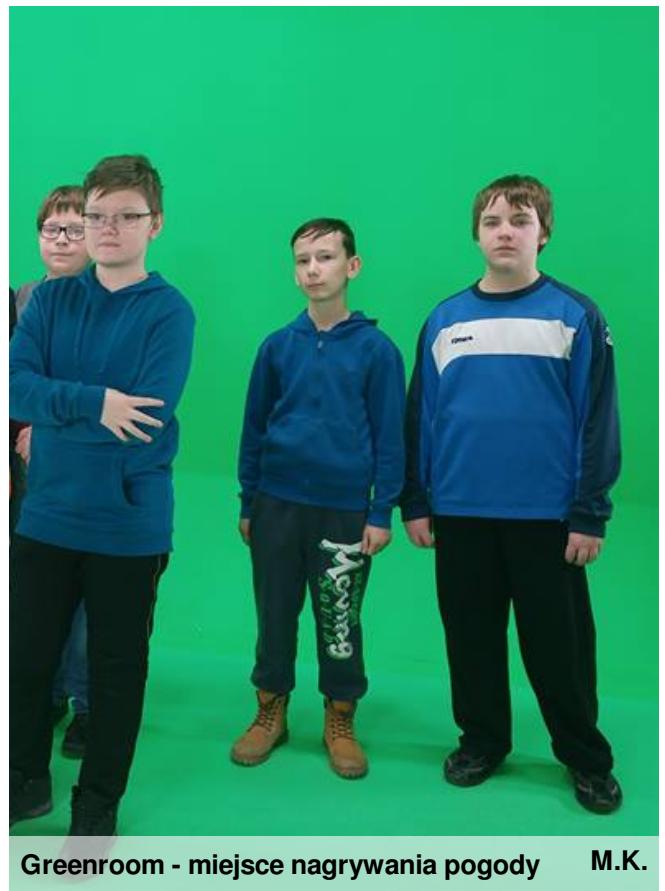
Greenroom - miejsce nagrywania pogody