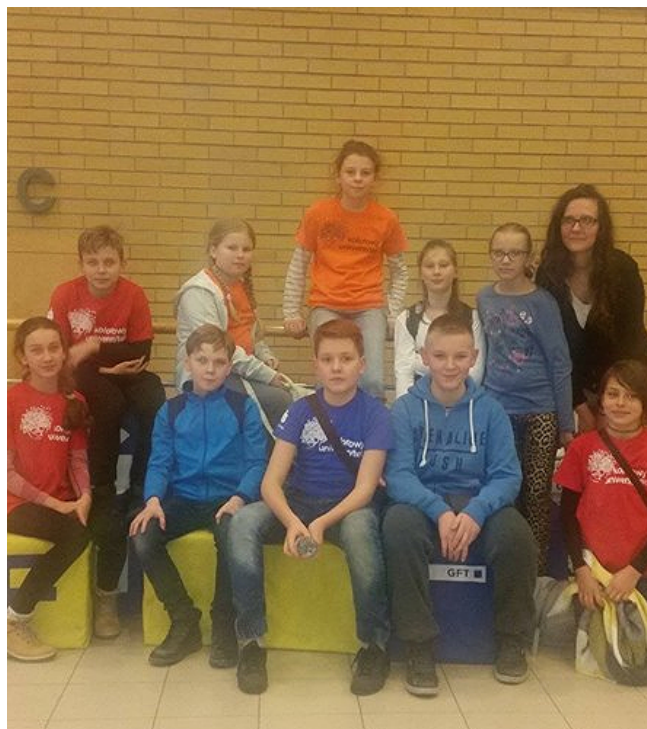
Uczestnicy Kolorowego Uniwersytetu