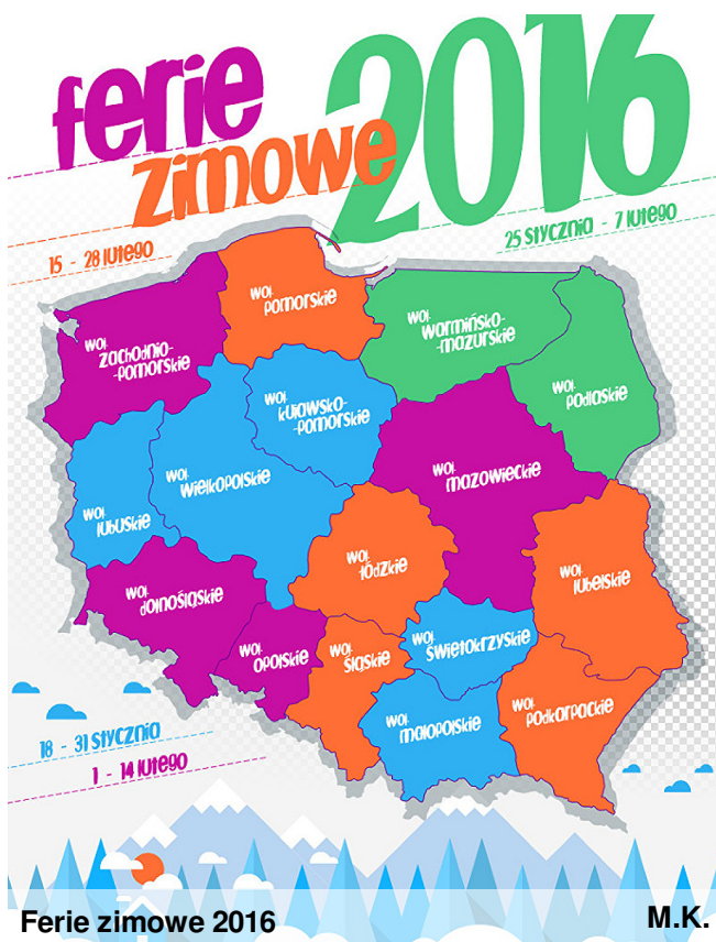
Ferie zimowe 2016