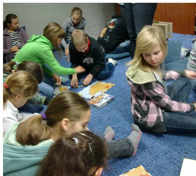
4 listopada 2011 GRY W SŁUŻBIE EDUKACJI

rodziców i obdarowanego dziecka. Spędzanie zbyt wielu godzin przed popularnymi konsolami do gier może spowodować obniżenie się wyników w nauce, a nawet pogorszenie stanu zdrowia. Tym bardziej, że aktywne spędzanie czasu jest coraz większą rzadkością wśród uczniów. Innym