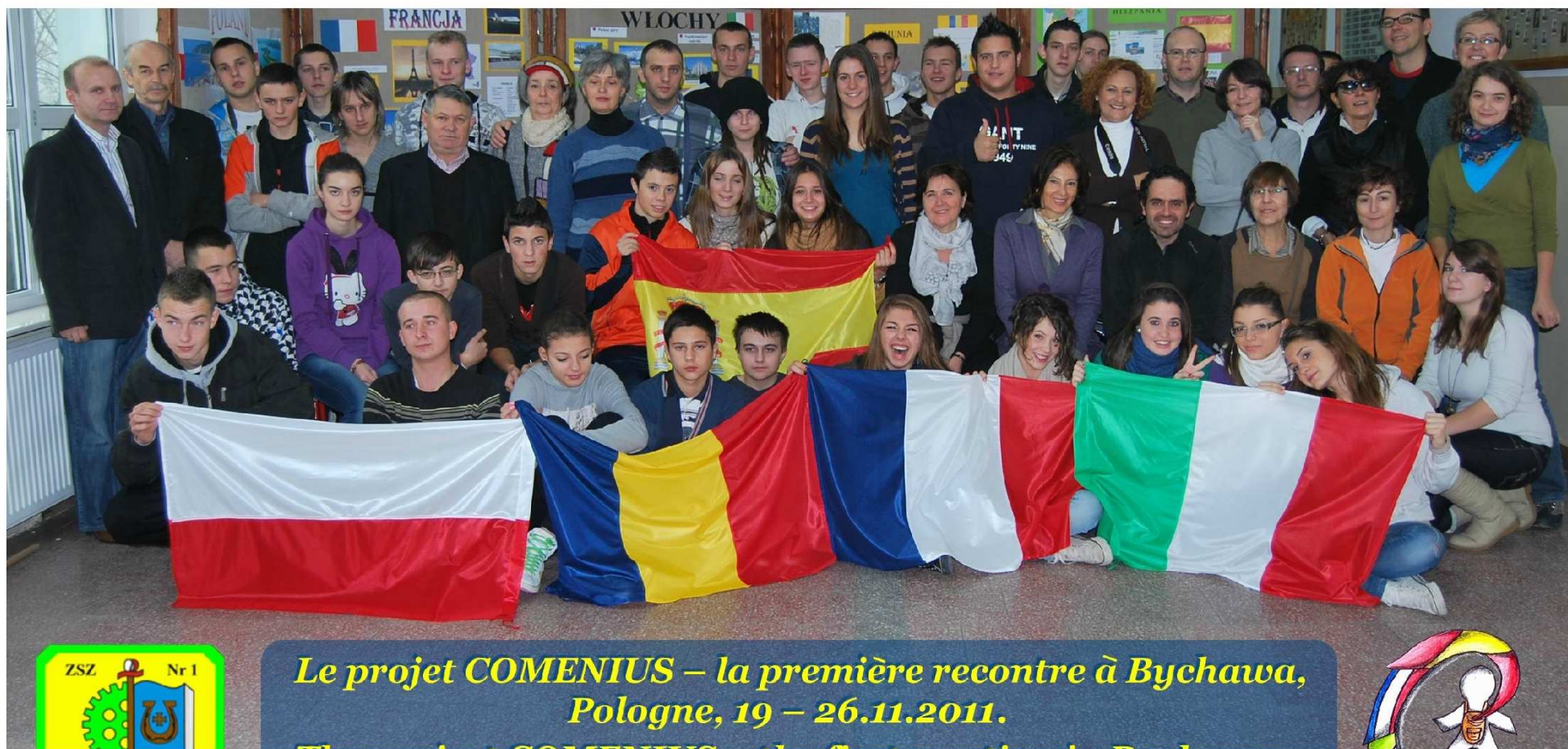
Le projet COMENIUS – la première rencontre à Bychawa, Pologne, 19 – 26.11.2011.

W dniach 19-26 listopada gościliśmy w naszej szkole uczniów i ich opiekunów ze szkół z: Francji, Hiszpanii, Rumunii, Włoch. Było to możliwe dzięki uczestnictwu naszej szkoły w projekcie Comenius. Głównym celem projektu jest rozwijanie wśród młodzieży i kadry nauczycielskiej wiedzy o różnorodności kultur i języków europejskich, a także nabywanie podstawowych umiejętności i kompetencji życiowych.