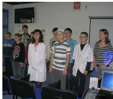
Szkolna drużyna FLL