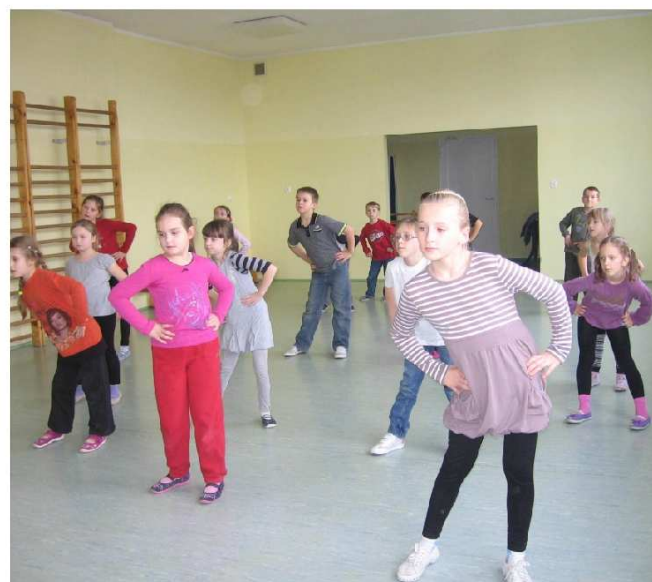
fotografia powyżej przedstawia uczniów kl.2c podczas warsztatów tanecznych, a zdjęcie po lewej młodych przyrodników podczas doświadczenia.