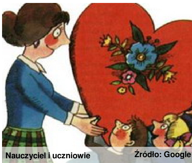
Nauczyciel i uczniowie