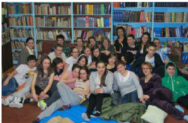
fot.: poniżej Oleśnica: czytamy o Witoldzie Pileckim