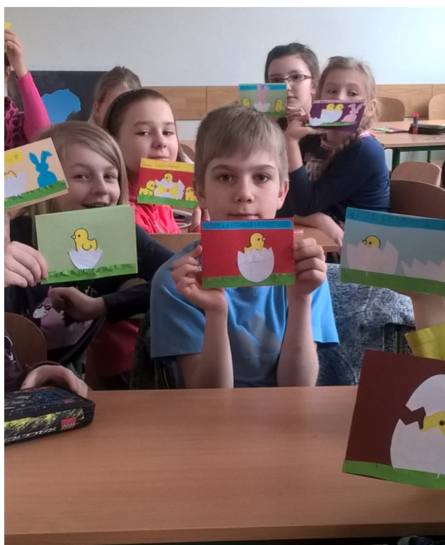
Nasze kartki wielkanocne

Zwyczaj wysyłania życzeń świątecznych stał się popularny na całym świecie w latach dwudziestych XX wieku. Kartka jest miłą niespodzianką i ozdobą, która postawiona choćby na stole, przez długi czas przypomina o tych, którzy ją do nas wysłali. My też na godzinie wychowawczej wykonaliśmy własne wielkanocne kartki. Zdobiliśmy je elementami związanymi ze świętami wielkanocnymi np: kurczaczki i króliczki. Następnie mieliśmy je wysłać do kogoś bliskiego, bo to piękny zwyczaj.