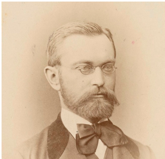
WOJCIECH KĘTRZYŃSKI - nasz patron.

Każdego roku obchodzimy Dzień Patrona naszej szkoły, którym jest Wojciech Kętrzyński. Był on wybitnym polskim historykiem, wieloletnim dyrektorem Zakładu Narodowego im. Ossolińskich we Lwowie oraz członkiem Towarzystwa Historycznego we Lwowie. Nasz patron dał się poznać jako historyk, etnograf, polityk, publicysta oraz poeta.