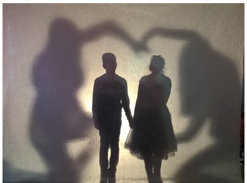
WYSTĘPUJĄ UCZNIOWIE KLASY 7A