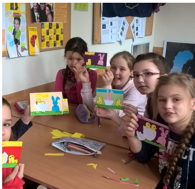
Każda kartka piękna .