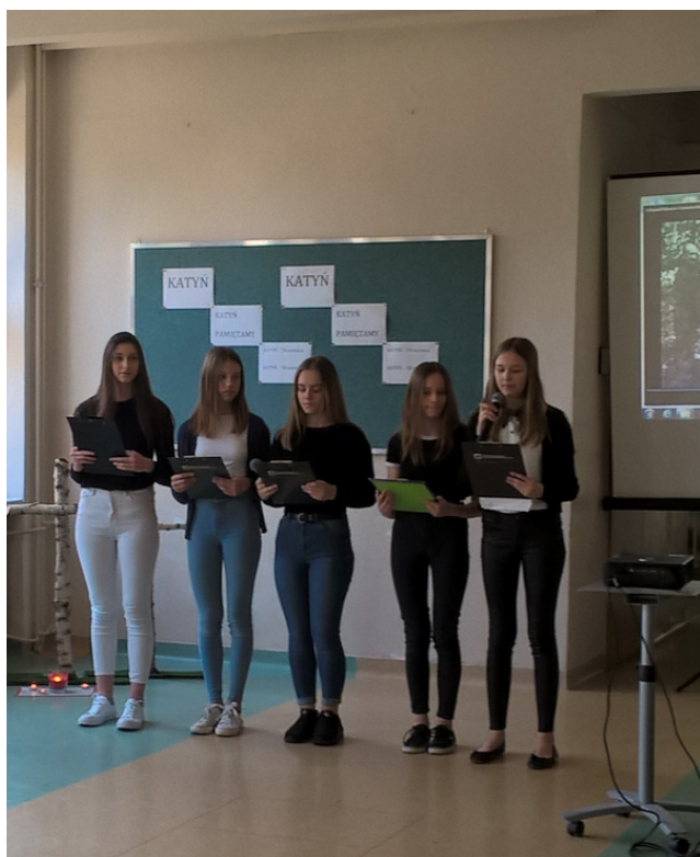
Uczennice z klasy 7b