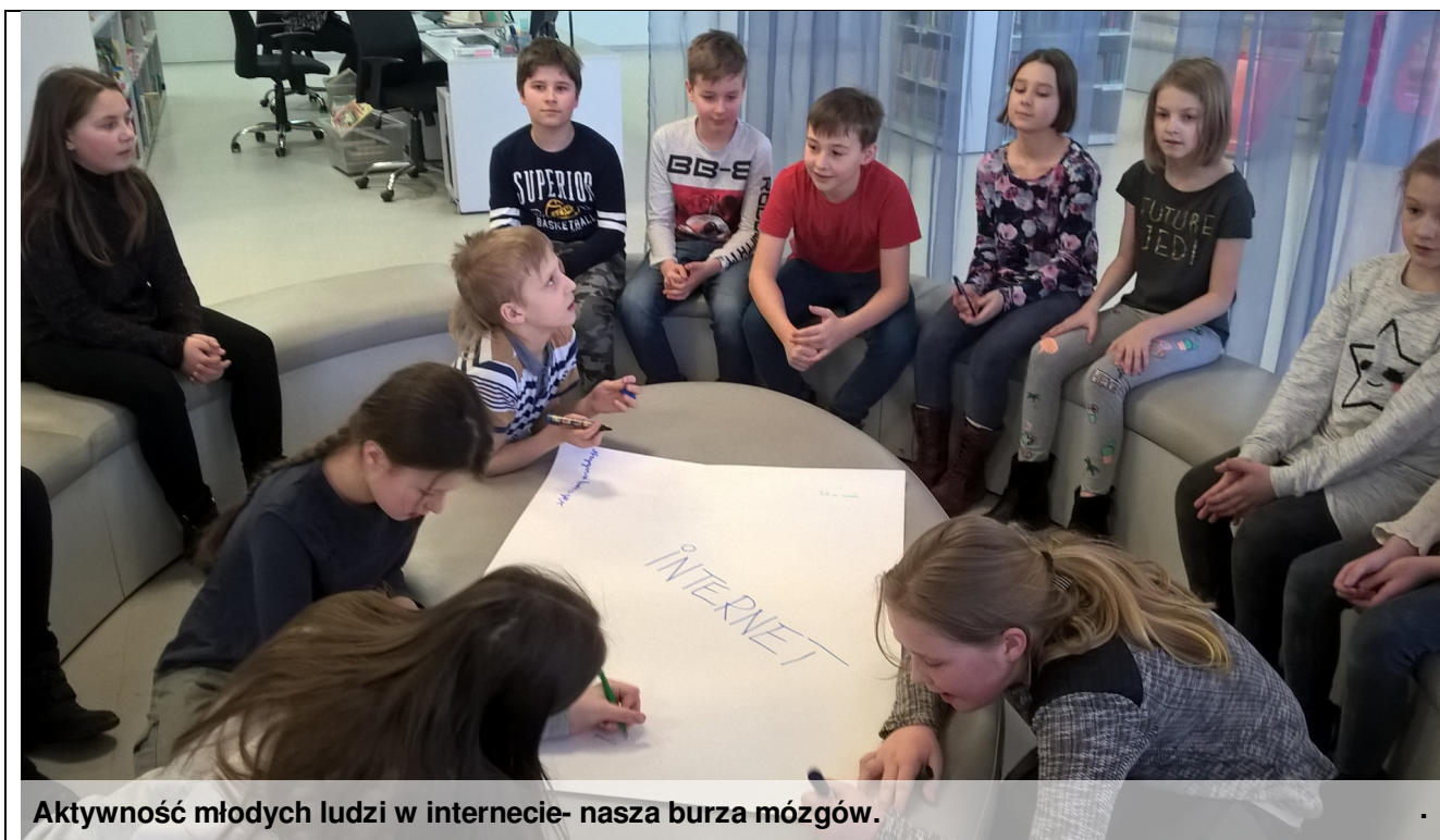
Aktywność młodych ludzi w internecie- nasza burza mózgów.