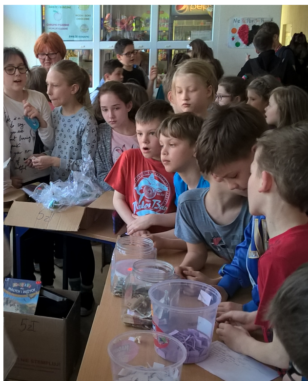
Zainteresowanie loterią było ogromne.