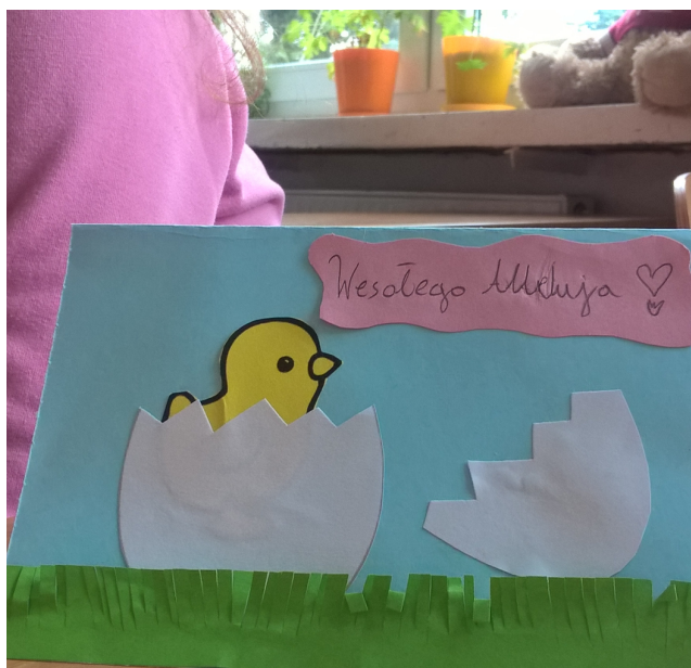
Wesołego Alleluja !