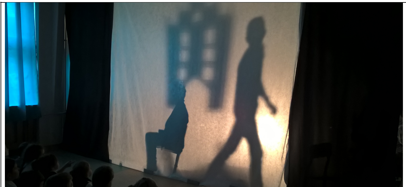
ŻYCIORYS WOJCIECHA KĘTRZYŃSKIEGO w SZKOLNYM TEATRZE CIENI.