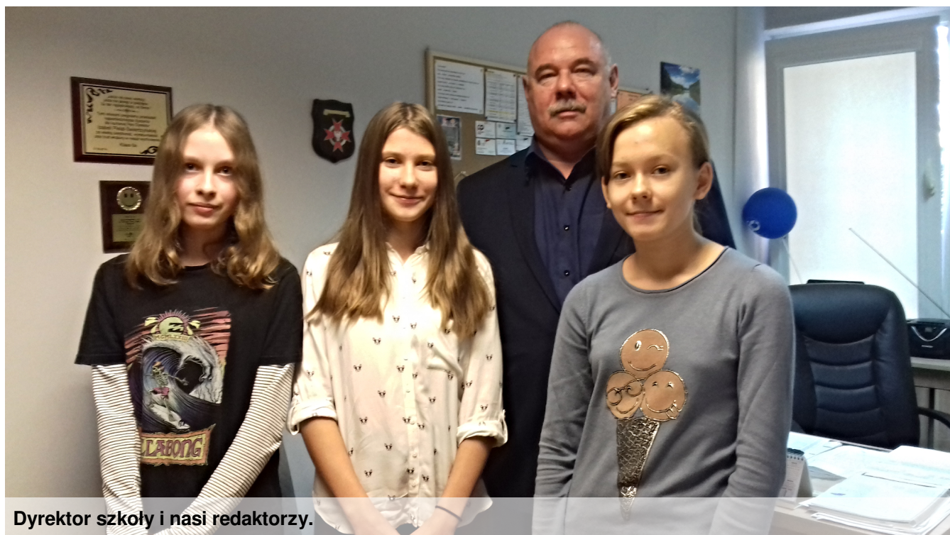
Dyrektor szkoły i nasi redaktorzy.