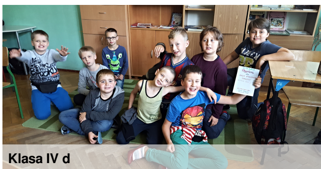
Klasa IV d

"Chłopak to stworzenie takie, co bywa różnorakie! Są weseli i szaleni, nie brakuje wśród nich leni. Czasem bardzo są poważni, często silni i odważni. Wciąż nastroje swe zmieniają, plany różne obmyślają. Ale mimo wszystkich wad, nudny bez nich byłby świat. Więc dnia tego dziękujemy, że wśród stworzeń tych żyjemy!"