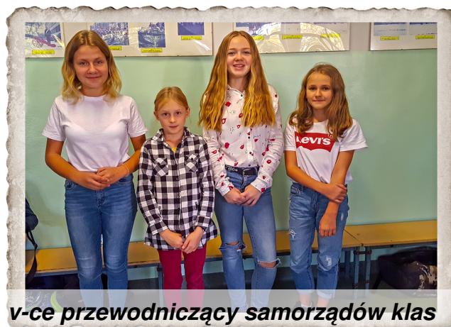
v-ce przewodniczący samorządów klas