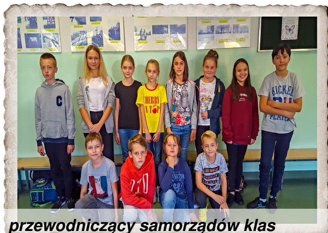
przewodniczący samorządów klas