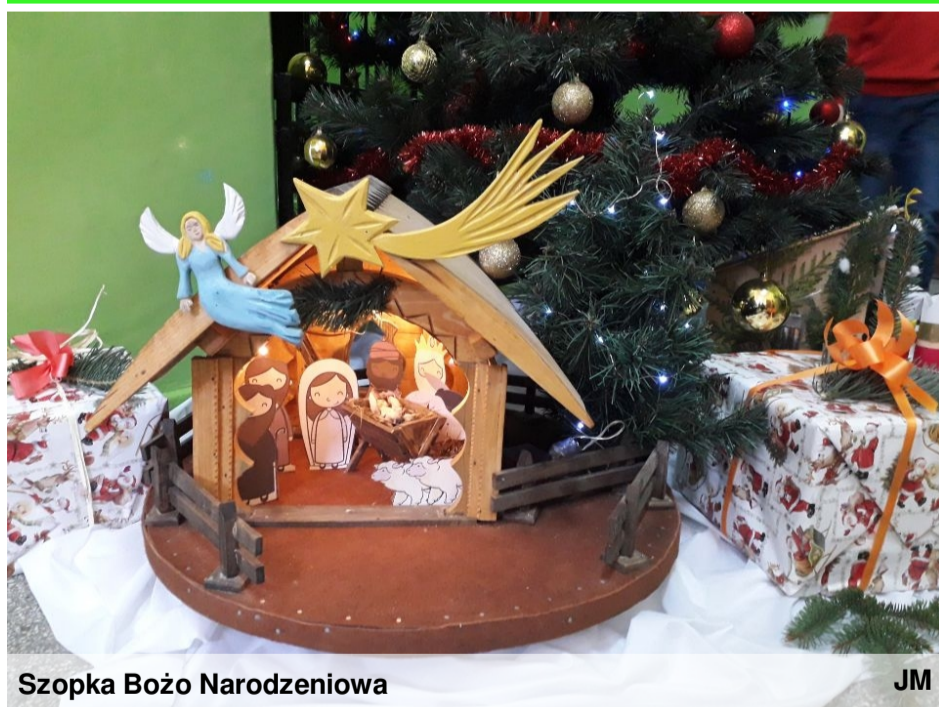
Szopka Bożo Narodzeniowa