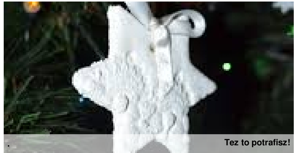
Tez to potrafisz!