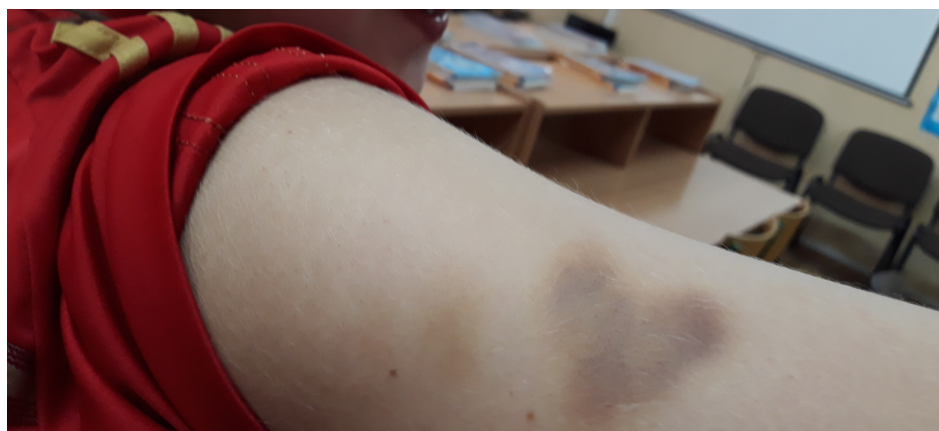
Siniak w kształcie serca??