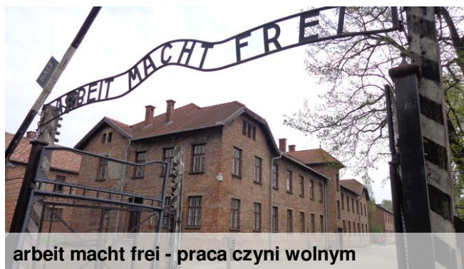
arbeit macht frei - praca czyni wolnym

Na jego terenie znajduje się obóz koncentracyjny Auschwitz zwany Birkenau. Został założony w 1940 r. przez hitlerowców. W ciągu trzech lat od 1942 do 1945r., w oświęcimskim obozie zginęło ok. 1,2 mln ludzi. Do dzisiaj zachowała się znaczna część zabudowań i obiektów obozowych. Wszystkie te obiekty stanowią obecnie muzeum.