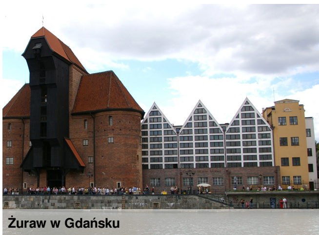
Żuraw w Gdańsku