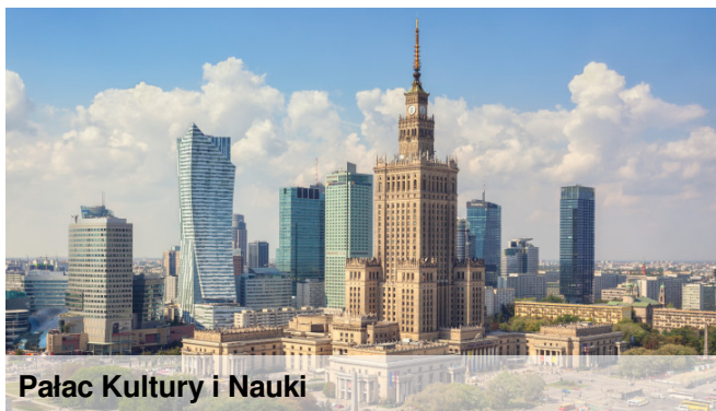
Pałac Kultury i Nauki