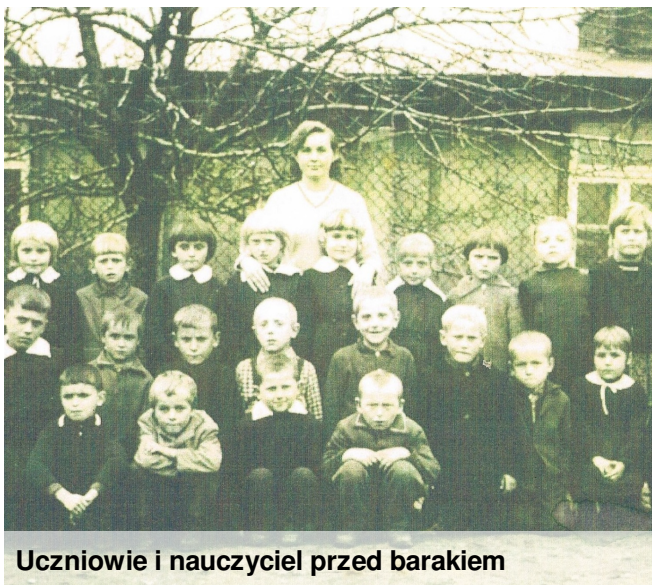
Uczniowie i nauczyciel przed barakiem

Budynek szkolny Szkoły Podstawowej w Bęczkowie zwano niegdyś „barakiem”, gdyż było to poniemiecki barak, który władze przyznały mieszkańcom wsi, spełniając ich prośbę.