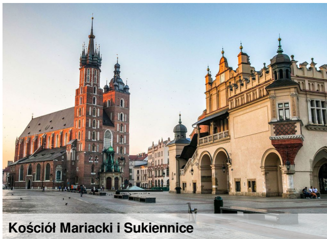
Kościół Mariacki i Sukiennice