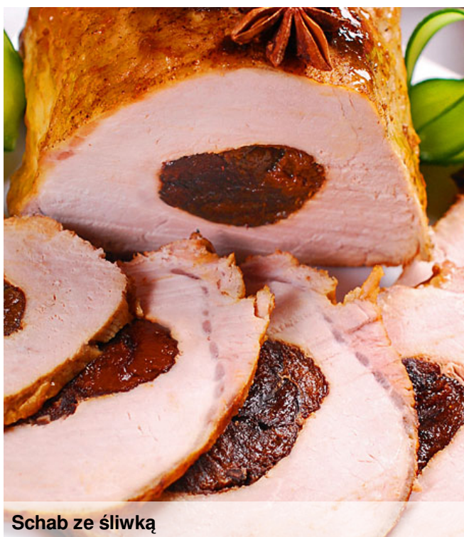
Schab ze śliwką