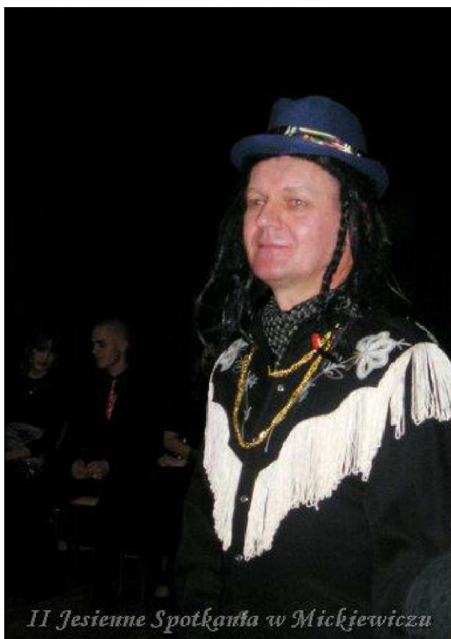
II Jesienne Spotkanie w Mickiewiczu