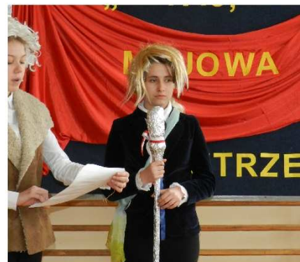
Na zdjęciach uczestnicy konkursu

I miejsce Szkoła Podstawowa nr 38 i Szkoła Podstawowa nr 42. Rywalizacja była zacięta, poziom drużyn bardzo wysoki i wyrównany. Wszyscy uczestnicy otrzymali nagrody książkowe, laureaci