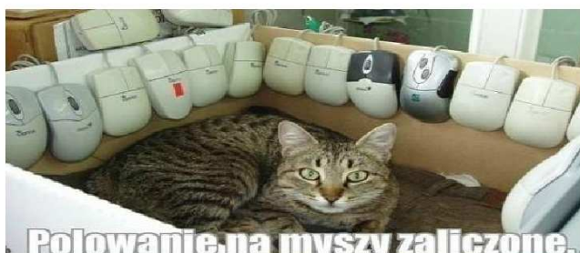
Polowanie na myszy zaliczone.

można dostrzec nie tylko w Europie. Najczęściej święto to pojawia się w niedzielę danego miesiąca, natomiast my Polacy świętujemy Dzień Matki, jako jedyni 26 maja. Najwięcej państw obchodzi Dzień Matki w drugą niedzielę maja i są to kraje rozrzucone po całym globie: USA, Australia, Kuba, Hongkong, Indie, Filipiny czy też Peru.