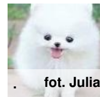
· fot. Julia