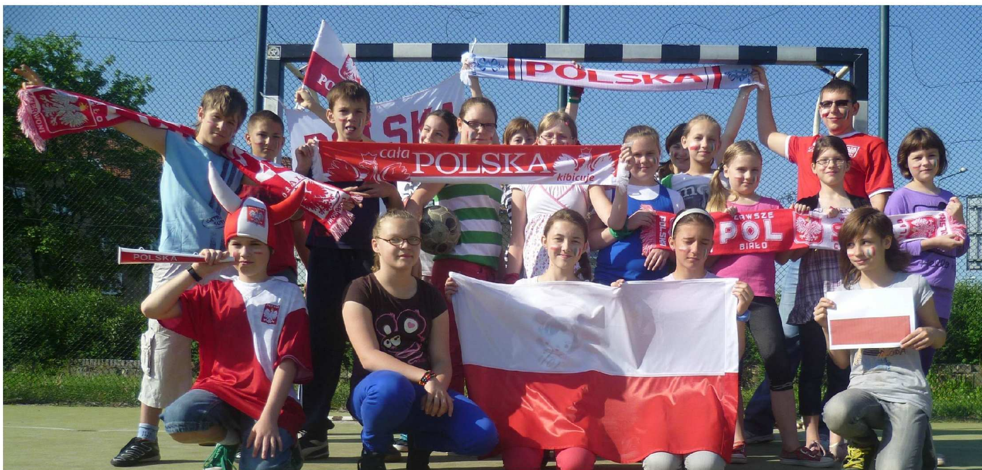
Na górze: Zespół redaktorów MATMOMANII.