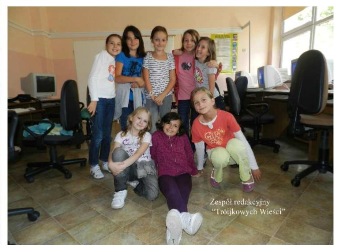
Zespół redakcyjny "Trójkowych Wiści"