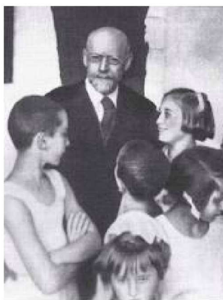
Janusz Korczak z wychowankami z sierotowca