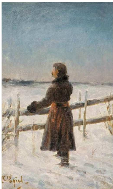
Tadeusz Popiel - obraz "Pierwsza gwiazdka"

W kościele Zachodu Wigilia Bożego Narodzenia jest obchodzona 24 grudnia.