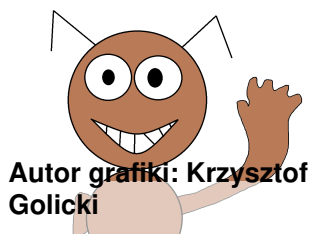
Autor grafiki: Krzysztof Golicki