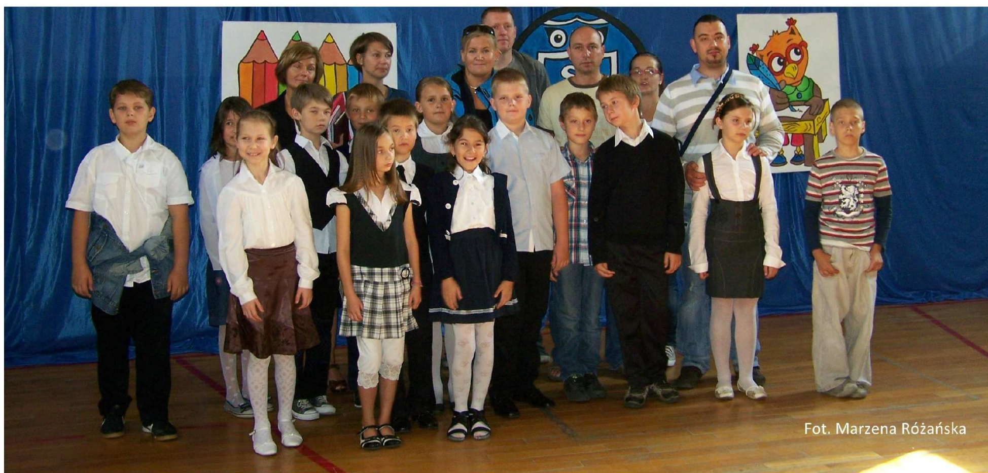
Fot. Marzena Różańska