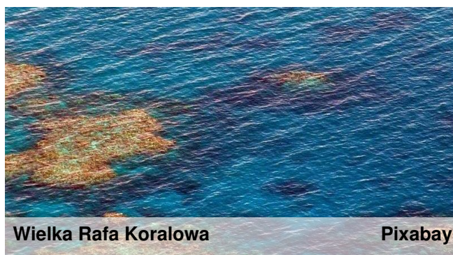
Wielka Rafa Koralowa