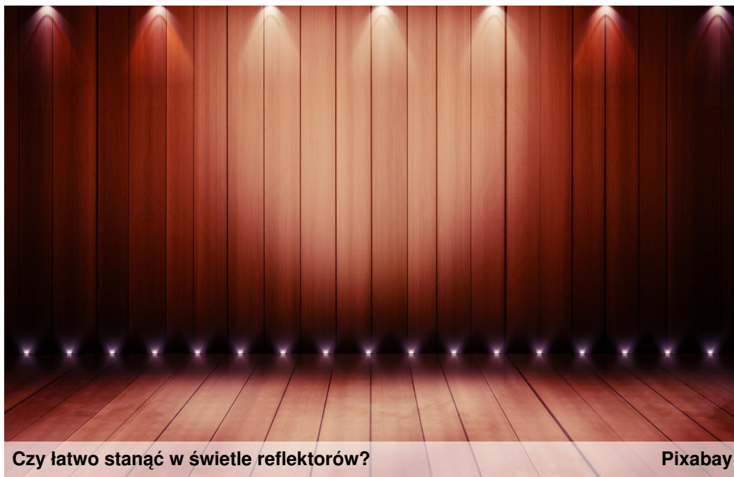
Czy łatwo stanąć w świetle reflektorów?