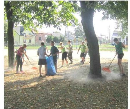
fot. uczniowie przy pracy...

ra akcji panią E. Polak i zatwierdzony przez panią dyrektor Danutę Dziubicką. Uczniowie klas I -VI pod opieką wychowawców i nauczycieli sprzątnęli teren wokół szkoły i obszar bezpośrednio przylegający do szkoły.** *****