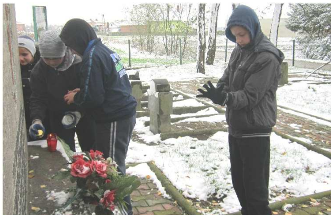
fol. uczniowie klasy V

Nad grobami unosi się zapach kwiatów oraz świeczek. Nasi uczniowie pamiętają i dbają o mogiły niemieckich żołnierzy.