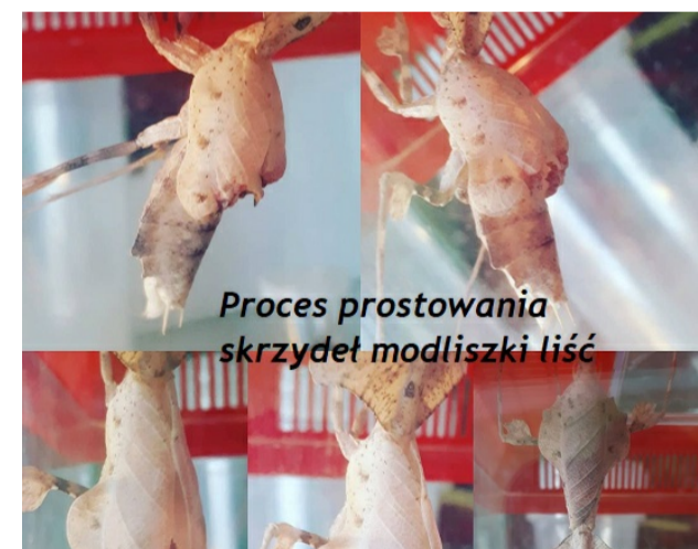
Proces prostowania skrzydeł modliszki liść