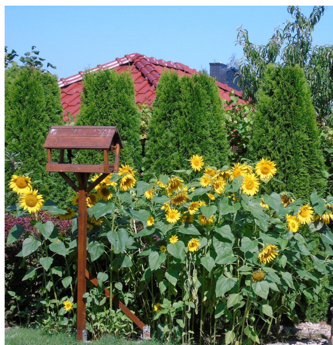
Te wszystkie słoneczniki wyrosły z nasion K. K. zrzuconych z karmnika!