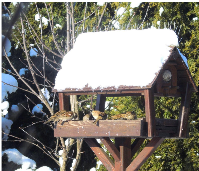
Mój karmnik cieszy się popularnością wśród K. K. wróbli.

Zima, mimo że wiele osób uważa ją za wspaniałą porę roku, to dla zwierząt bardzo trudnym okresem. Spójrzmy przykładowo na ptaki. Nasiona, dżdżownice, małe ssaki, owady i mięczaki są zimą trudno dostępne. Ale teraz zadajmy sobie pytanie - czy możemy pomóc tym zwierzętom? Odpowiedź brzmi: tak! Głównym sposobem na to