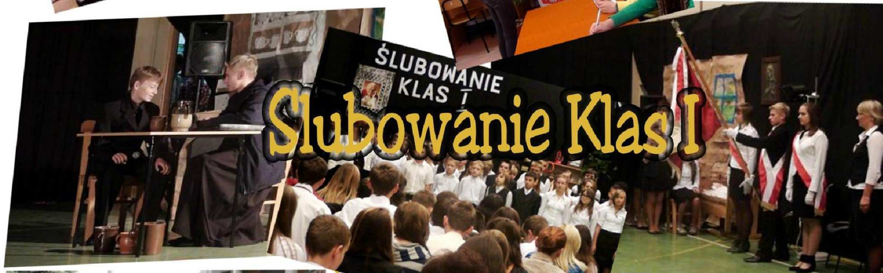
Ślubowanie Klas I