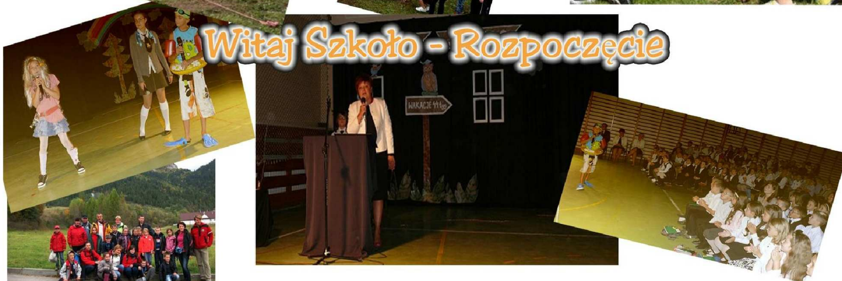
Witaj Szkoło - Rozpoczęcie