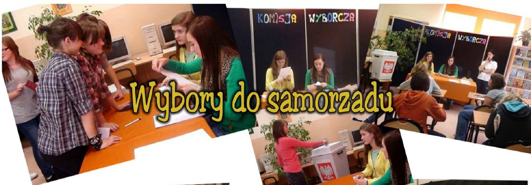
Wybory do samorządu