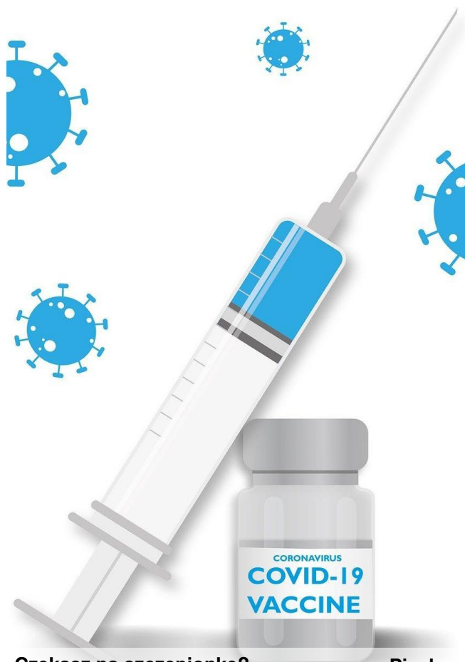
Czekasz na szczepionkę?