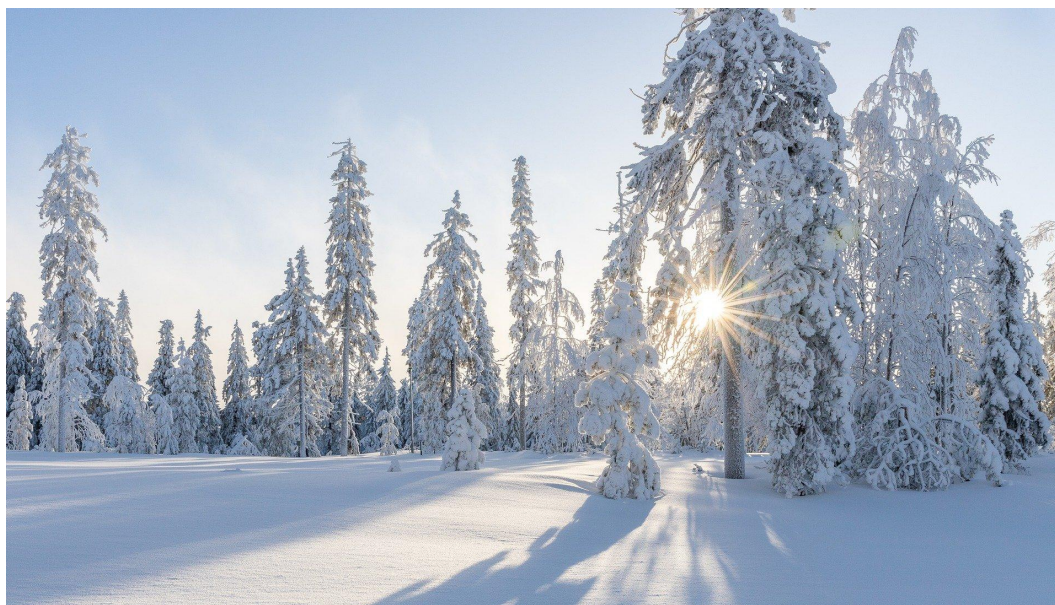
Śnieg nie wyklucza zmian klimatycznych!