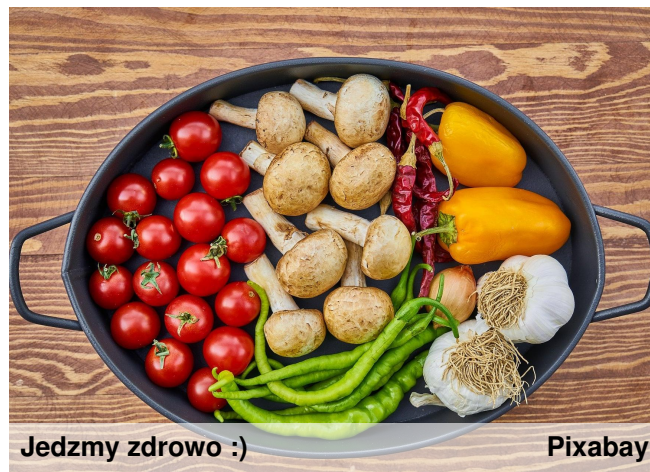
Jedzmy zdrowo :)