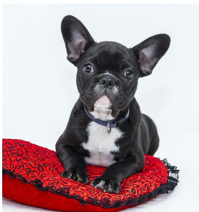
Porozmawiasz ze mną?