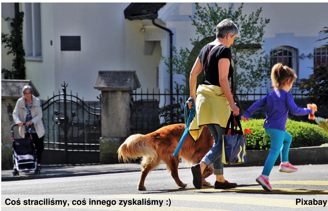
Coś straciliśmy, coś innego zysaliśmy :)