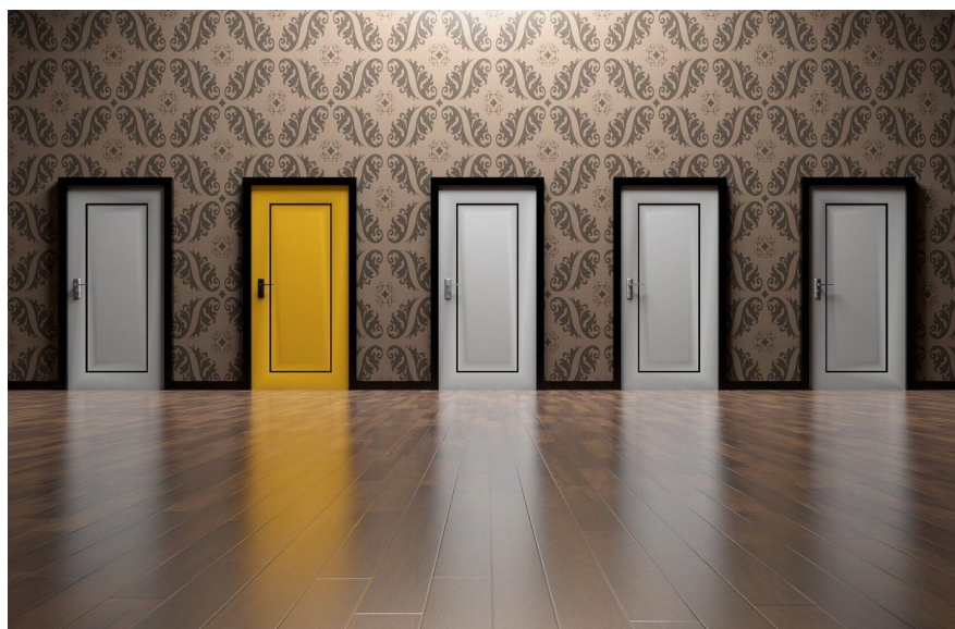
Przyszłość - które drzwi otworzyć?