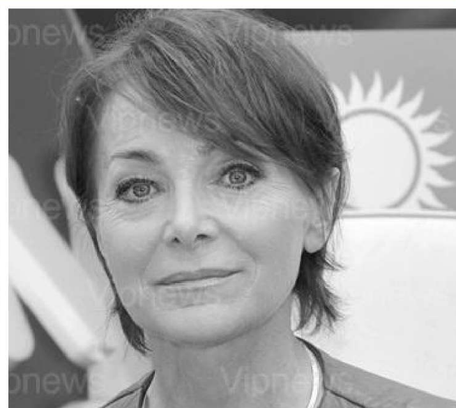
IRENA JAROCKA wielka gwiazda polskiej piosenki (na zdj.) ANDRZEJ ŁAPICKI nazywany amantem polskiego kina (na zdj.)