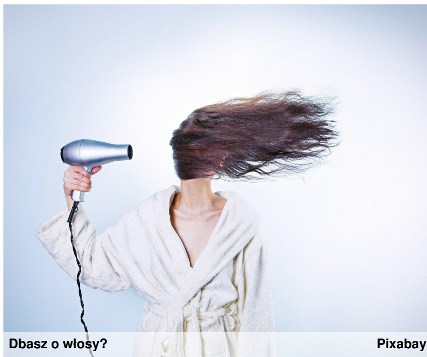
Dbasz o włosy?