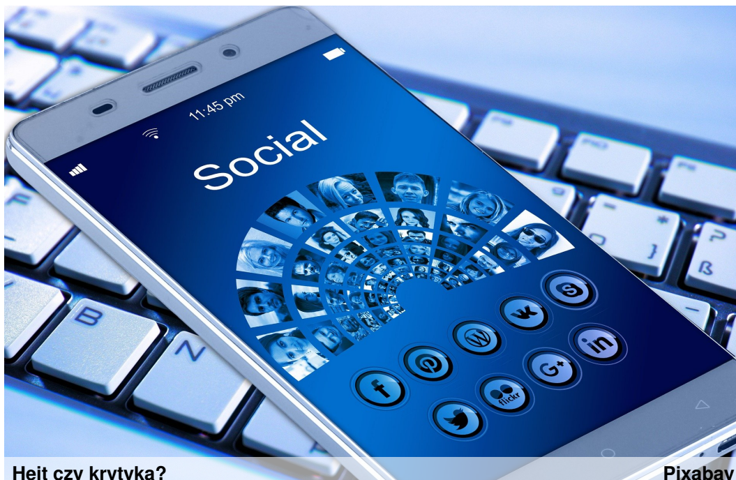
Hejt czy krytyka?